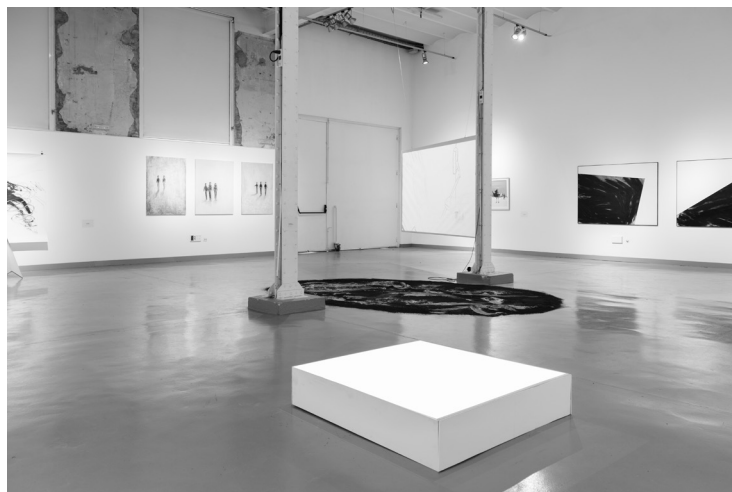
Vista de la sala expositiva de l'Espai d'Arts de Roca Umbert, 2016.

El repte és construir discurs i passar d'un pla més directe a posicionar l'activitat artística dins del pensament i de la reflexió del sector artístic, amb el treball amb crítics i comissaris, que enriqueixen i donen nous continguts.