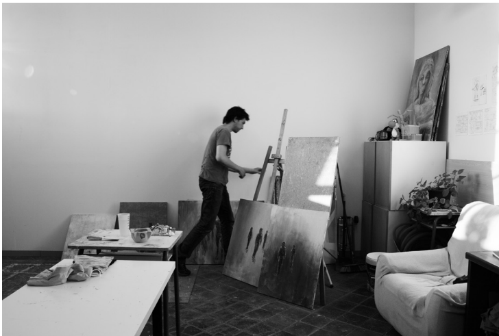
Interior d'un taller d'un artista resident de la línia de treball d'arts visuals i imatge, 2016. Autor: Roc Pont. Roca Umbert Fàbrica de les Arts.

Ponències Revista del Centre d'Estudis de Granollers, 22 (2018), 7-38