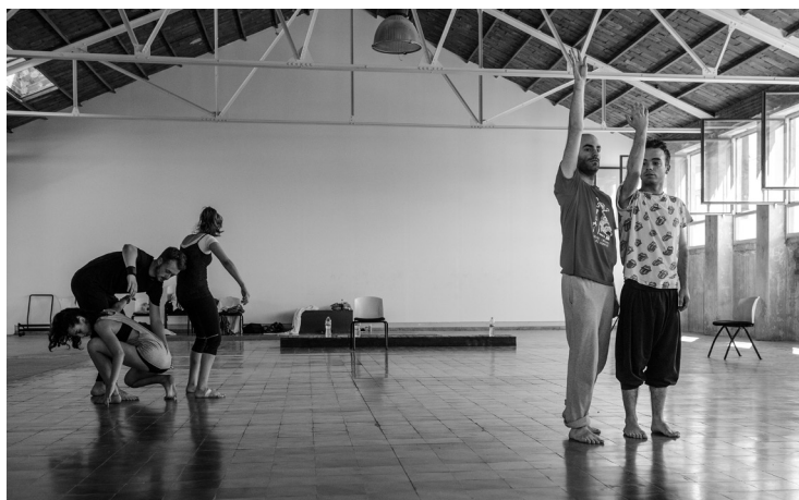
Residència d'una companyia emergent al Centre d'Arts en Moviment de Roca Umbert, 2016. Autor: Roc Pont. Roca Umbert Fàbrica de les Arts.

L'equipament es va inaugurar l'any 2016 i disposa de dues sales, una amb linòleum i parquet específic per a dansa, de 236,25 m 2 , i una altra d'oberta amb rajola hidràulica, de 492,05 m 2 .