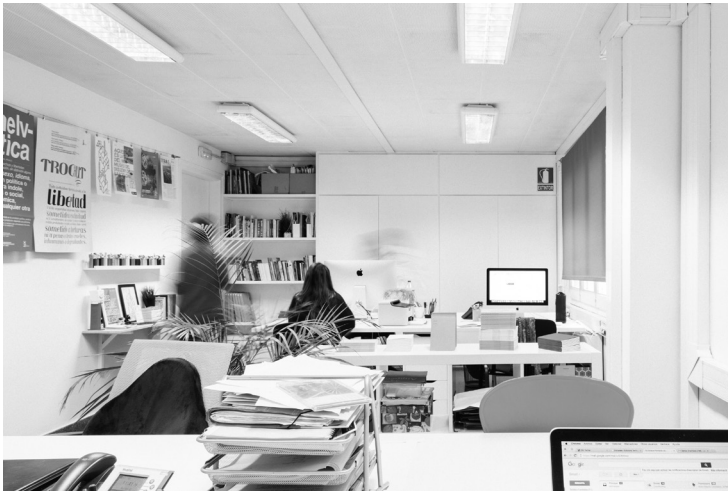
Imatge d'un espai de coworking per a empreses i emprenedors de la indústria cultural i creativa, 2016. Autor: Roc Pont. 2016. Roca Umbert Fàbrica de les Arts.

Ponències Revista del Centre d'Estudis de Granollers, 22 (2018), 7-38