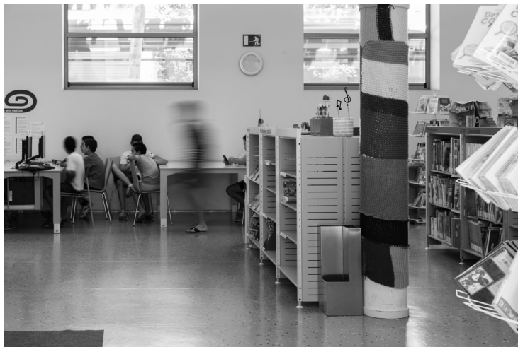
Interior de la zona infantil de la Biblioteca Roca Umbert, 2016. Autor: Roc Pont. Roca Umbert Fàbrica de les Arts.

Finalment, el projecte Booktrailer és recent (es va posar en marxa el curs escolar 2016-2017). La proposta, que es vinculava amb les àrees de llengua i literatura i amb visual i plàstica, oferia la possibilitat de conèixer el procés de realització dels booktrailers a partir de la lectura i l'anàlisi d'una novel·la juvenil. Dirigit a alumnes de 1r o 2n d'ESO dels instituts de Granollers, implica un mínim de sis sessions d'una hora, i anualment hi participen cinc instituts de la ciutat. Se celebra un acte de cloenda a la sala Nau B1 al qual assisteixen els instituts participants i s'hi presenten els booktrailers resultants.