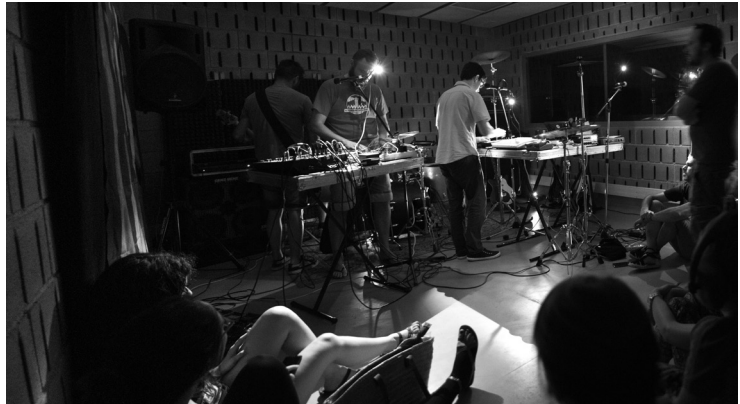
Fotografia de l'interior dels bucs d'assaig musical, 2016. 2016. Roca Umbert Fàbrica de les Arts.

Ponències Revista del Centre d'Estudis de Granollers, 22 (2018), 7-38