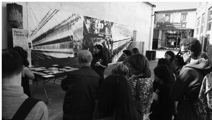
Visita comentada a les intervencions artístiques que es realitzen arreu del recinte amb motiu de la MAU (Mostra d'Art Urbà), 2016. Roca Umbert Fàbrica de les Arts.