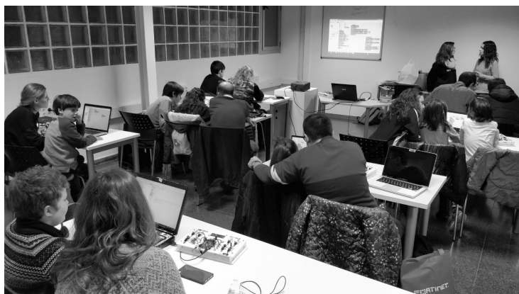
Imatge d'un taller de tecnologia, 2016. Roca Umbert Fàbrica de les Arts.