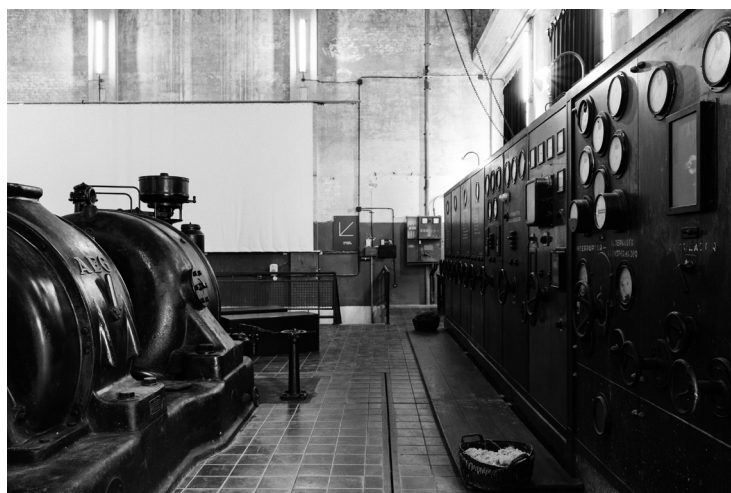
Vista de la secció de producció energètica de la Tèrmica, una museografia poc intervencionista que ajuda a fer un viatge al passat i a comprendre com funcionava i com s'hi treballava, 2016. Autor: Roc Pont. Roca Umbert Fàbrica de les Arts.

En el terreny del patrimoni industrial immaterial, entre el 2005 i el 2008 es va portar a terme, en col·laboració amb l'Arxiu Municipal de Granollers, un projecte de la memòria històrica de la fàbrica (i per extensió de la ciutat) amb