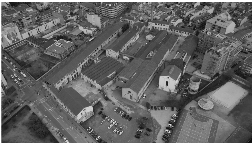
Vista aèria de la fàbrica, 2018. Autor: Roger Franch.

Ponències Revista del Centre d'Estudis de Granollers, 22 (2018), 7-38