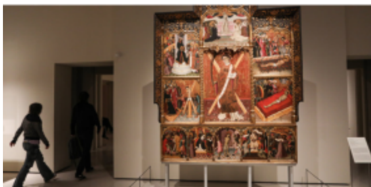
De Bernat Martorell a Coll