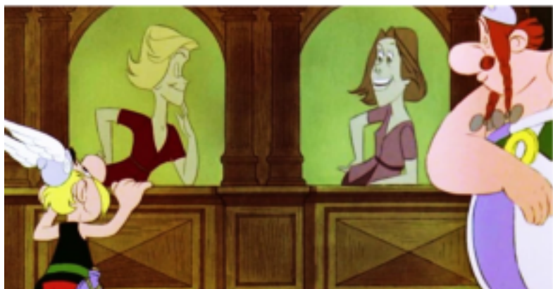
Cuando la burocracia mató a la política