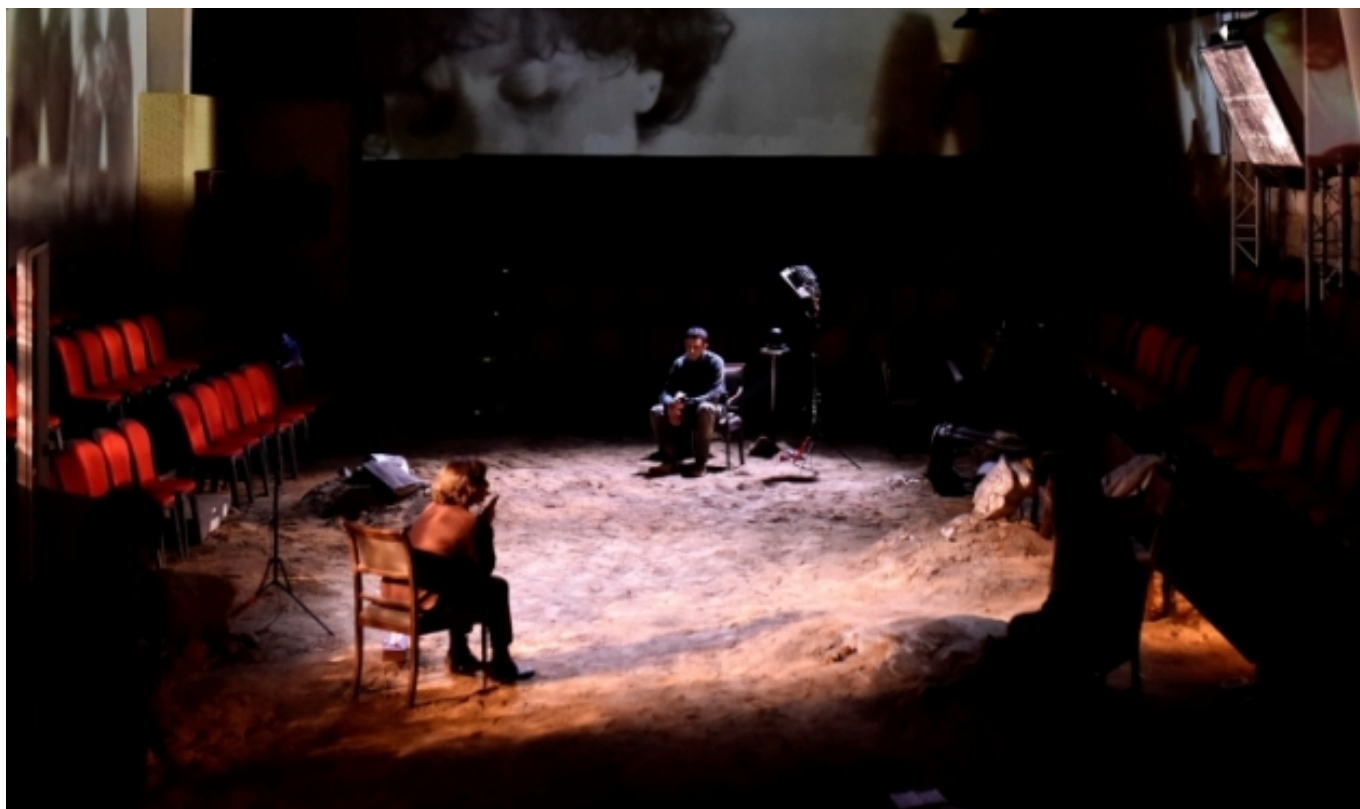
La guerra no té rostre de dona de La Perla 29 | laperla29.cat [5]

El primer gran bloc de l'informe aporta una extensa anàlisi del context socioeconòmic espanyol previ a l'esclat de la pandèmia – en el qual s'identifiquen l'etapa de la gran recessió (2008-14) i el període d'estabilització posterior (2015-19) – amb èmfasi en el sector cultural i, així mateix, en l'àmbit de les arts escèniques. Hi trobem dades relatives a la situació dels espais escènics i festivals, de les companyies i empreses del sector, del volum d'activitat o de la despesa pública i la participació dels públics previs a la pandèmia.