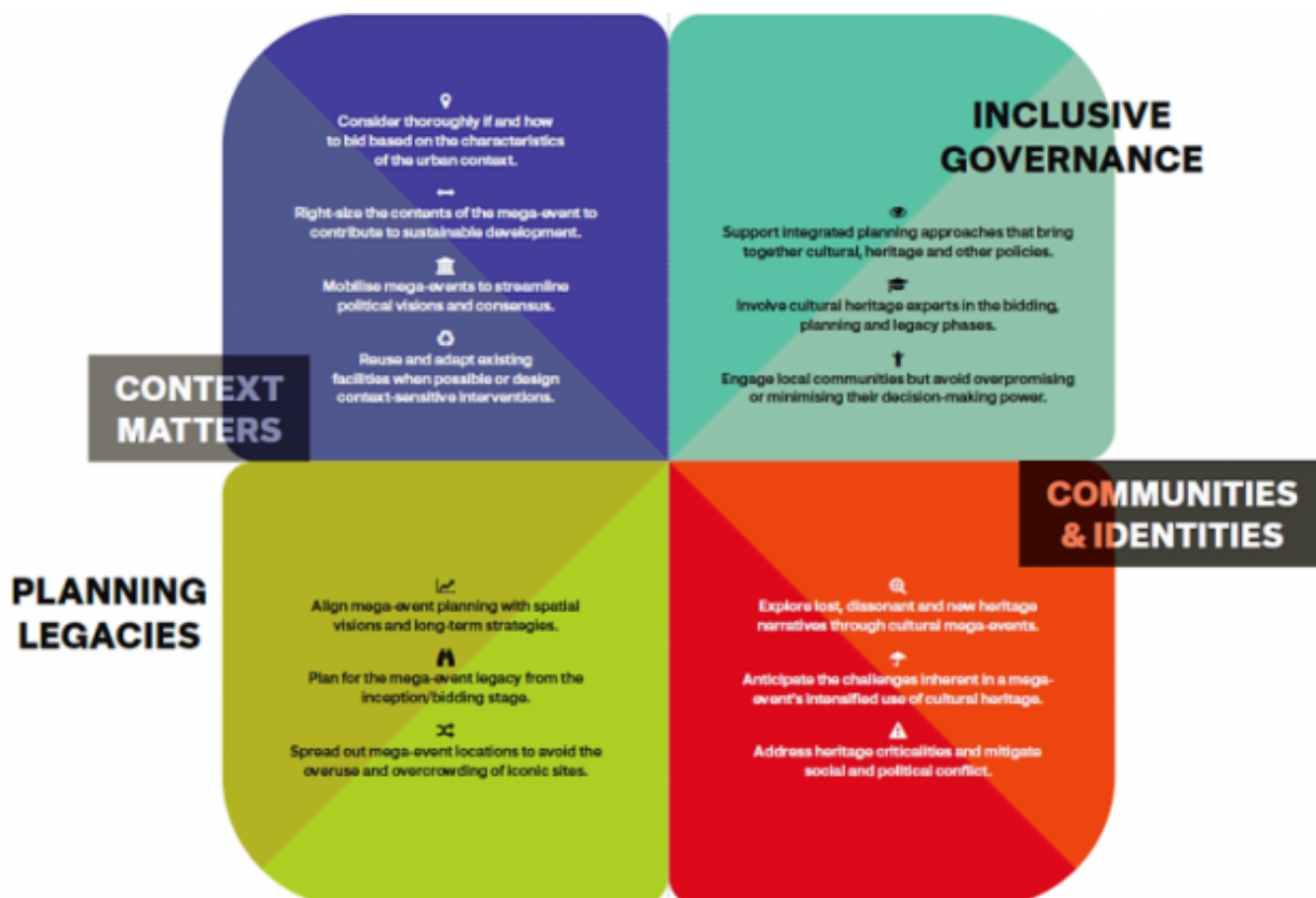
Principis clau de la Carta per a megaesdeveniments en ciutats patrimonials

El document analitza els reptes que suposen els megaesdeveniments per a la governança local . Per fer-ho possible, es basa en diverses experiències de ciutats patrimonials europees per oferir recomanacions que pretenen ajudar a aprofitar les oportunitats que ofereixen aquests esdeveniments i mitigar els possibles riscos i tensions que puguin sorgir en els espais històrics.