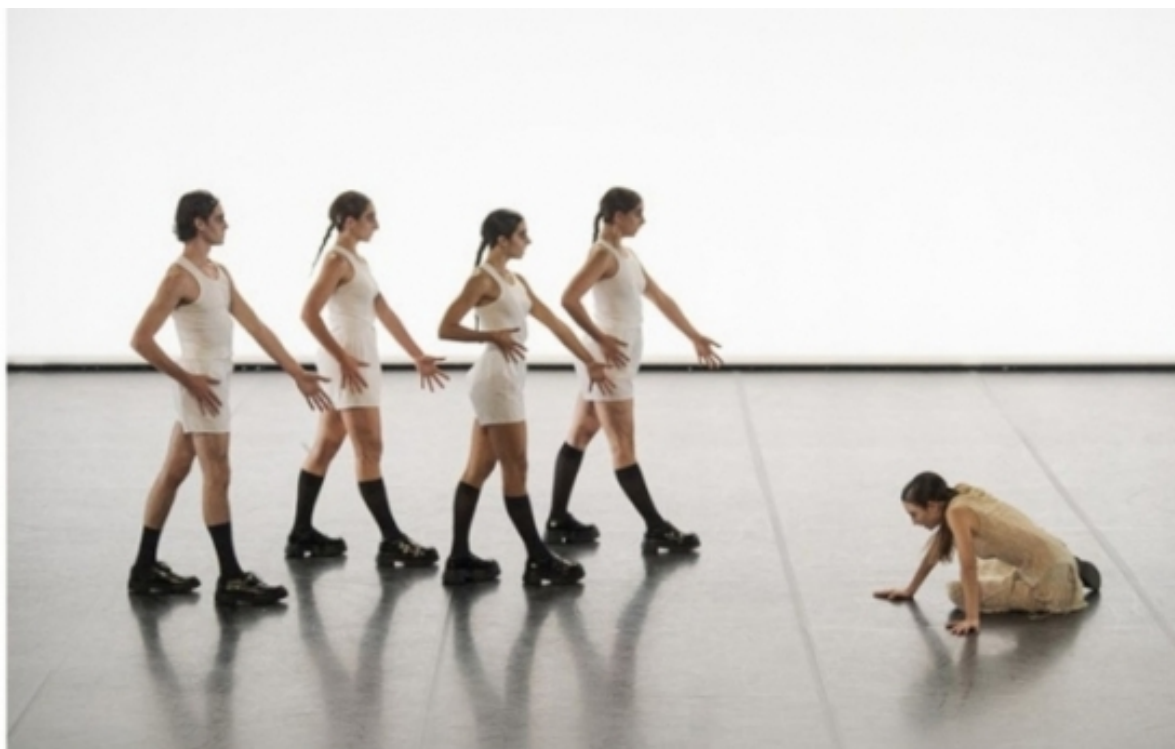
Black Sun, guanyadora del Premi de Dansa de l'IT 2021

L'exploració s'ha articulada, essencialment, al voltant de cinc blocs: el paper de la distribució en la cadena de valor de les arts escèniques; les capacitats, competències, formació i experiència dels distribuïdors; les barreres i desafiaments més importants; el sistema públic d'ajuts ; i les propostes de millora de les condicions laborals dels professionals de la distribució.