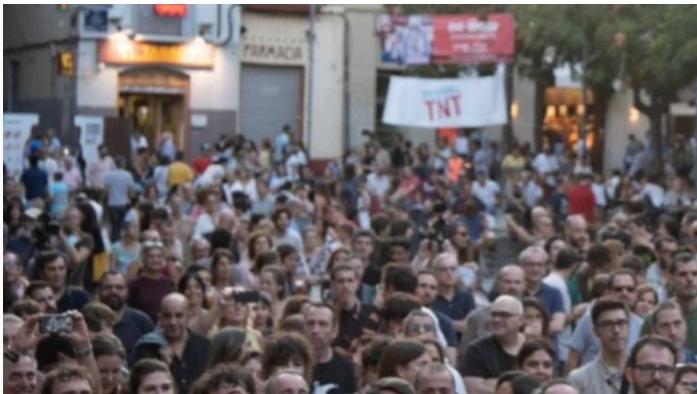
Festival TNT | tp.cat [3]

El primer bloc presenta com les avaluacions d'impacte social poden ajudar les organitzacions a potenciar estratègicament el seu impacte positiu i a reforçar la seva posició en la societat. A més, s'expliquen els conceptes d'impacte i avaluació i s'ofereix una descripció del concepte d'impacte social a partir de la literatura publicada en aquest àmbit.