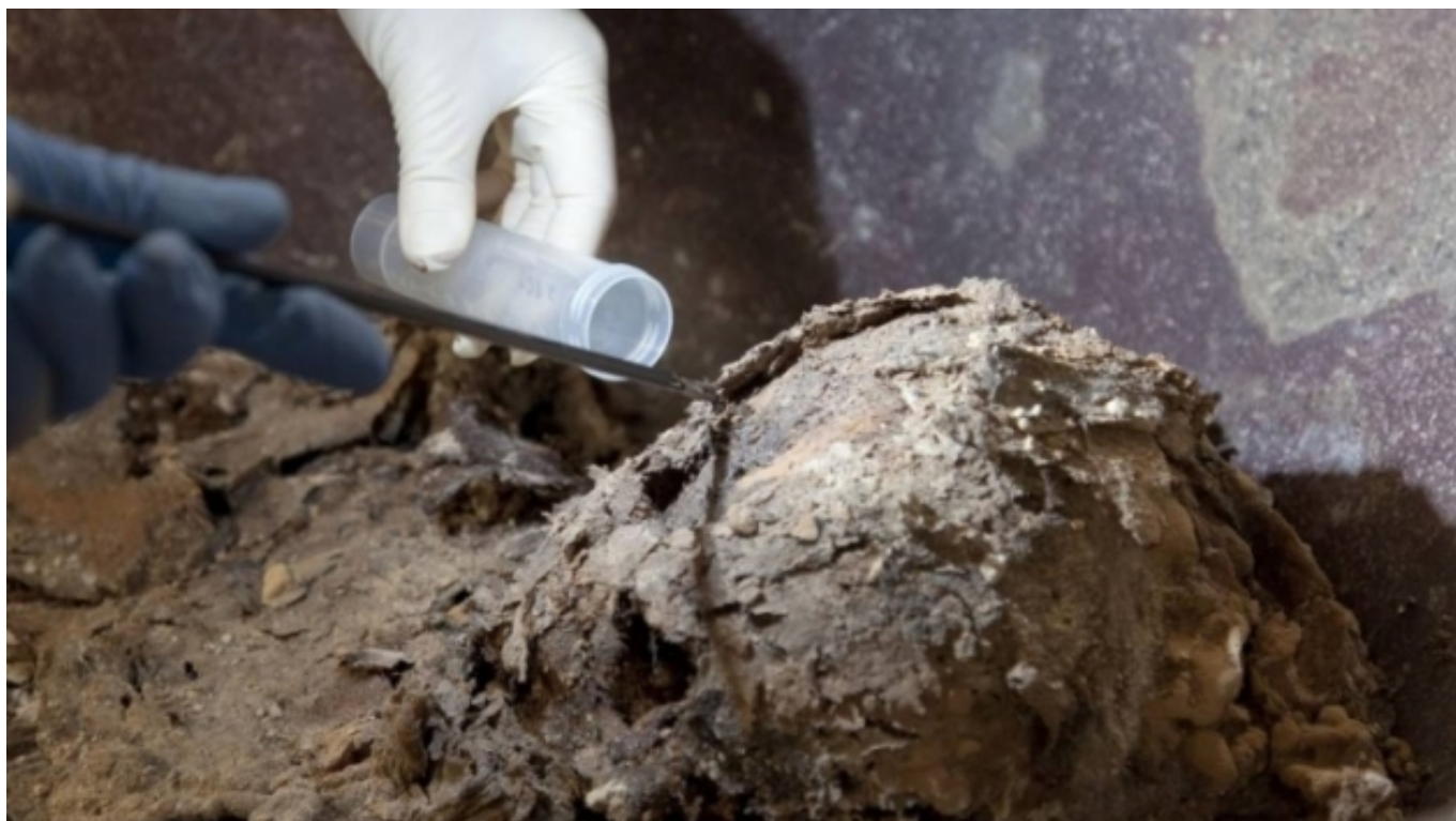
Recollida de mostres a la tomba de Pere el Gran | centrederestauracio.gencat.cat [4]

L'objectiu del projecte és identificar les carències existents en la qualificació del sector del patrimoni a Europa i superar així la bretxa entre els sistemes educatius i ocupacionals , amb la finalitat de garantir la viabilitat del sector i il·lustrar la seva contribució a la sostenibilitat social, econòmica i mediambiental.