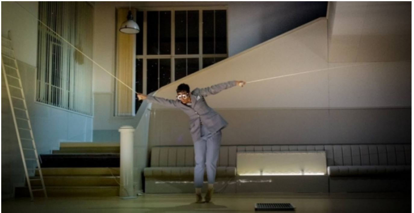
Pasionaria de La Veronal | Alex Font

Partint del vessant teòric recollit al manifest (publicat l'octubre de 2021), aquesta iniciativa també incorpora una sèrie de projectes pràctics relacionats amb els ambiciosos temes clau del manifest :