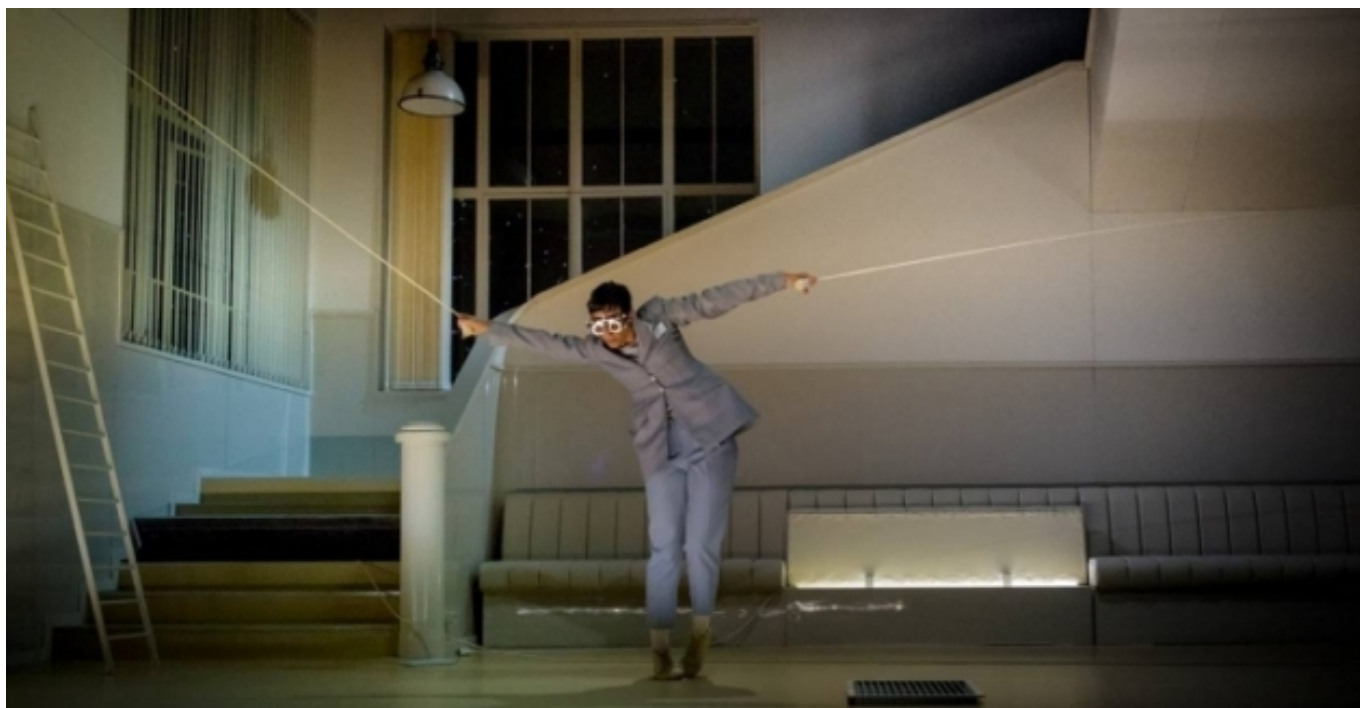
Pasionaria de La Veronal | Alex Font

Partint del vessant teòric recollit al manifest (publicat l'octubre de 2021), aquesta iniciativa també incorpora una sèrie de projectes pràctics relacionats amb els ambiciosos temes clau del manifest :