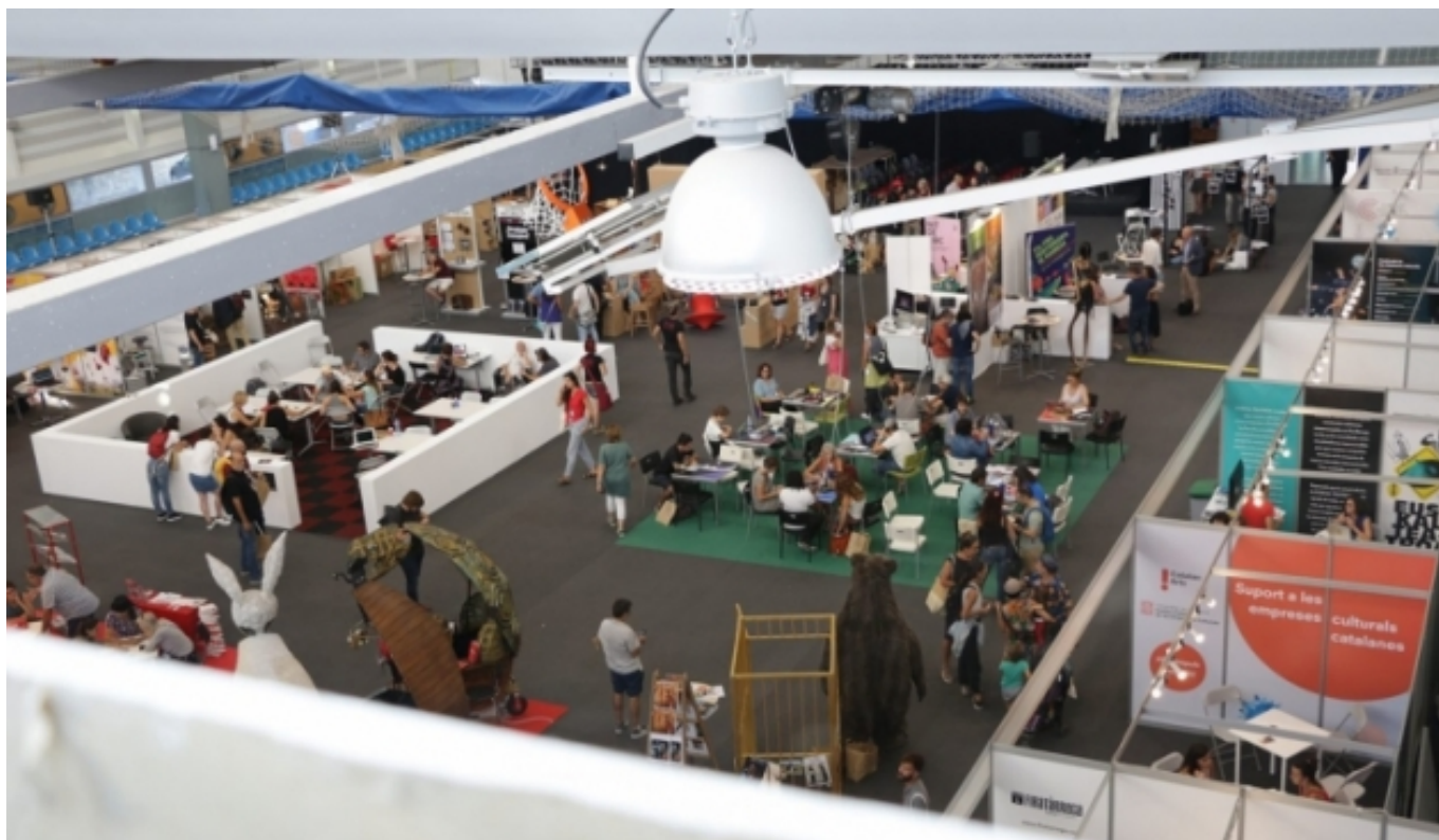
Llotja de professionals a Firatàrrega | Firatàrrega

Els resultats mostren que un 80% de les entitats internacionals que assisteixen a les fires ho fan de forma puntual i només el 20% restant mostra cert grau de fidelització. Cal destacar, però, el cas de FiraTàrrega , que es desmarca de la resta d'experiències i acull a gairebé la meitat (un 46,4%) de les entitats provinents d'altres països que assisteixen a alguna de les fires. Més enllà de centrar-se només en l'arribada d'entitats internacionals, FiraTàrrega compta amb una estratègia permanent i està present en fòrums i festivals internacionals, dinamitzant l'exportació de companyies d'arts escèniques, esdevenint una de les seves forteses. El rànquing el segueixen la Fira Mediterrània de Manresa , amb el 16,9% d'assistents internacionals, i la Fira de Teatre de Titelles de Lleida , que ocupa la quarta posició amb el 6,9%.