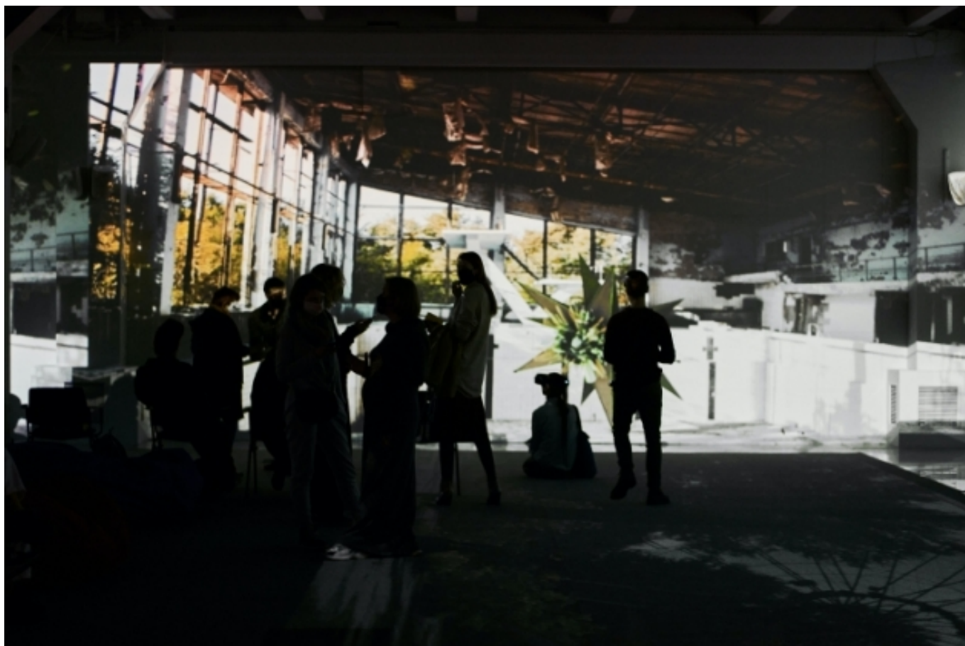
Presentació de l'exposició virtual sobre Txernòbil | Artefact.live [11]

L'últim grup, dedicat al desenvolupament de connexions professionals en la nova normalitat, inclou experiències com ara un programa B2B en línia per a editors i agents literaris [12], una hackatò virtual [13] i una trobada en format híbrid organitzada per l' IETM [14] des de diverses localitzacions en 2020.