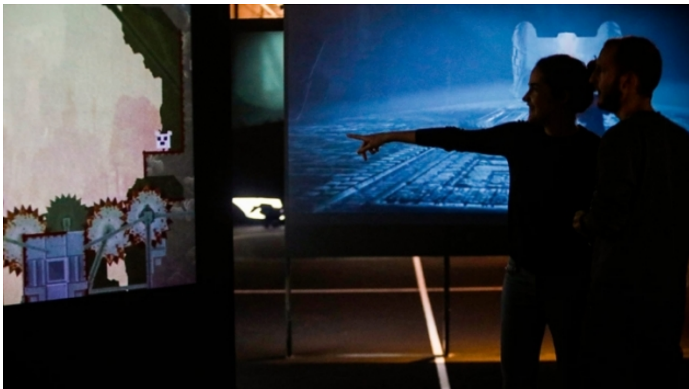
Exposició Gameplay al CCCB. cccb.org [3]

La publicació obre amb una aproximació a l'estat de la qüestió, centrada a identificar els elements clau de l'oferta cultural digital i de la participació digital. Aquest apartat contempla els reptes que suposa separar pràctiques online i offline , així la inapropiada distinció entre creació (artistes) i recepció (públics) a l'era dels mitjans participatius i la digitalització. La línia que separa a l'artista i al públic es difumina cada vegada més a mesura que augmenta la fidelització de públics en les arts online .