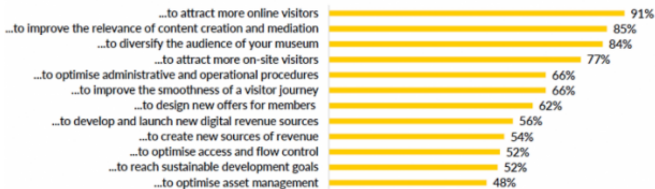
Raons per aplicar noves tecnologies en 2020

Entre altres qüestions, l'enquesta revela que tan sols el 28% dels museus enquestats va dissenyar i posar en marxa nous formats digitals com a forma d'ingressos digitals per pal·liar els efectes de la crisi. D'altra banda, les principals raons que han dut els museus consultats a aplicar noves tecnologies són atreure més visitants en línia (91%), millorar la rellevància de la creació de continguts i mediació (85%) o diversificar els públics dels museus (84%).