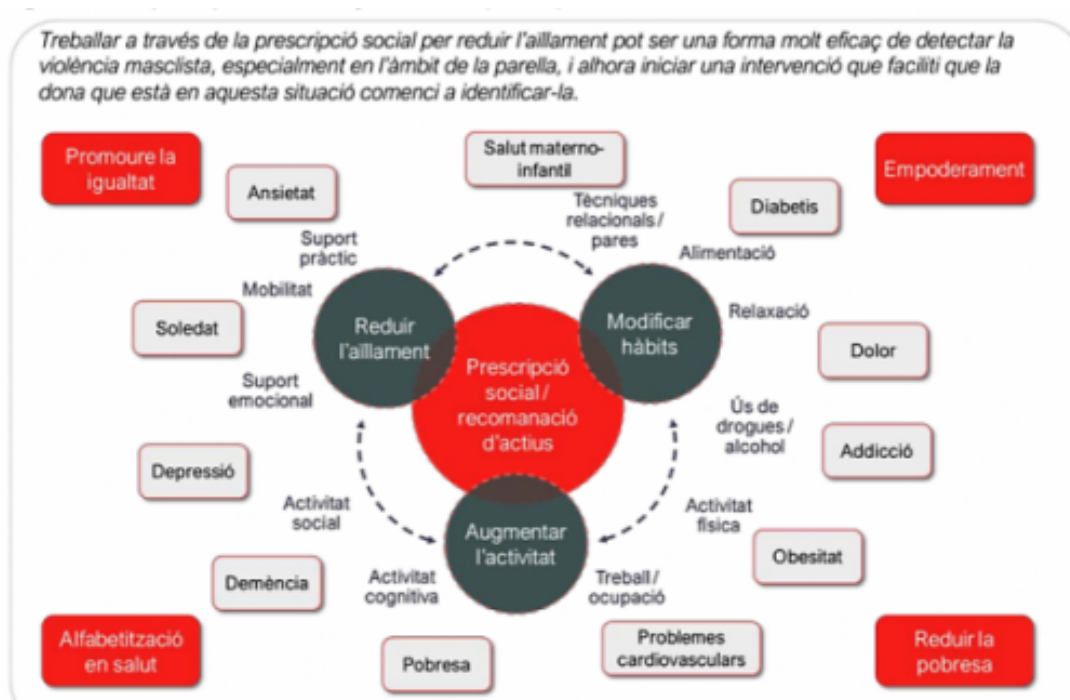
Múltiples aplicacions i objectius de la prescripció social

Aquesta guia pretén ser l'eina de referència per als i les professionals de l'atenció primària i d'altres serveis sanitaris que vulguin implementar un programa de prescripció social utilitzant els recursos disponibles a la comunitat.