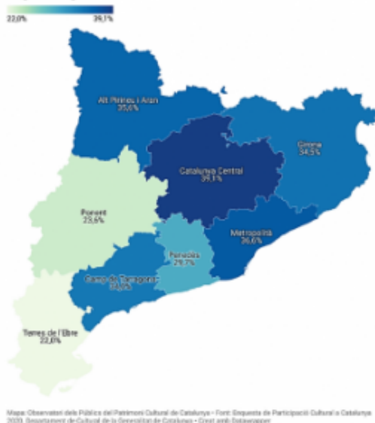
EPCC-2020. Visitants a museus i altres centres expositius segons vegueries

D'altra banda, el nivell d'estudis o la renda familiar disponible també han sigut factors determinants en la propensió de les persones a visitar o no visitar espais expositius. Entre les persones sense estudis i les persones amb estudis de primer grau, la visita a centres expositius ha caigut en més de la meitat. Quant a les llars amb uns ingressos mensuals inferiors a 1.320 €, la taxa dels visitants se situa a penes en el 20%, mentre que a les llars on aquests ingressos superen els 2.585 € aquesta taxa arriba al 49%.