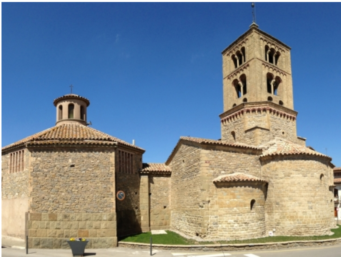
Església romànica de Santa Eugènia de Berga. santaeugenia.cat [5]

L'Ajuntament de Santa Eugènia de Berga basa la seva política cultural, principalment, en donar suport a les activitats organitzades per les entitats socials i culturals. Els habitants mostren interessos culturals com anar al teatre, i, en menor mesura, visitar una exposició, anar a un concert o a un museu, però normalment han de buscar aquestes activitats fora del municipi. Davant d'aquesta situació, l'estratègia de retenció de públic de l'ajuntament ha estat oferir la total gratuïtat de les propostes culturals.