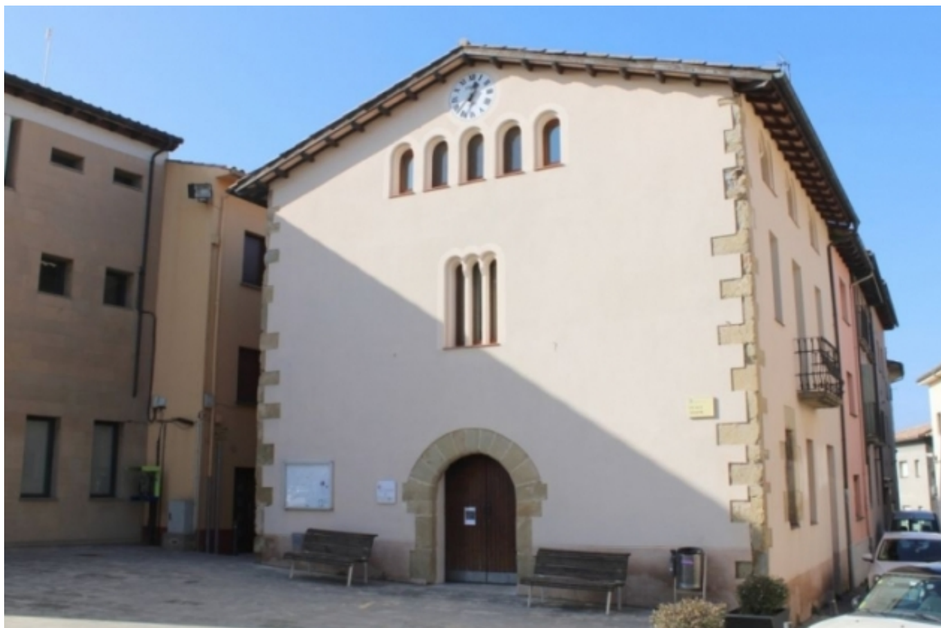
Centre Cívic de Santa Eugènia de Berga. santaeugenia.cat [5]

L'estratègia del Pla d'acció cultural de Santa Eugènia de Berga s'estructura en: