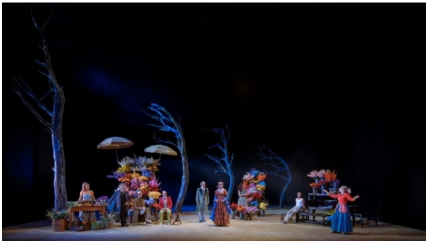
La Rambla de les Floristes , espectacle amb més assistents en 2020.