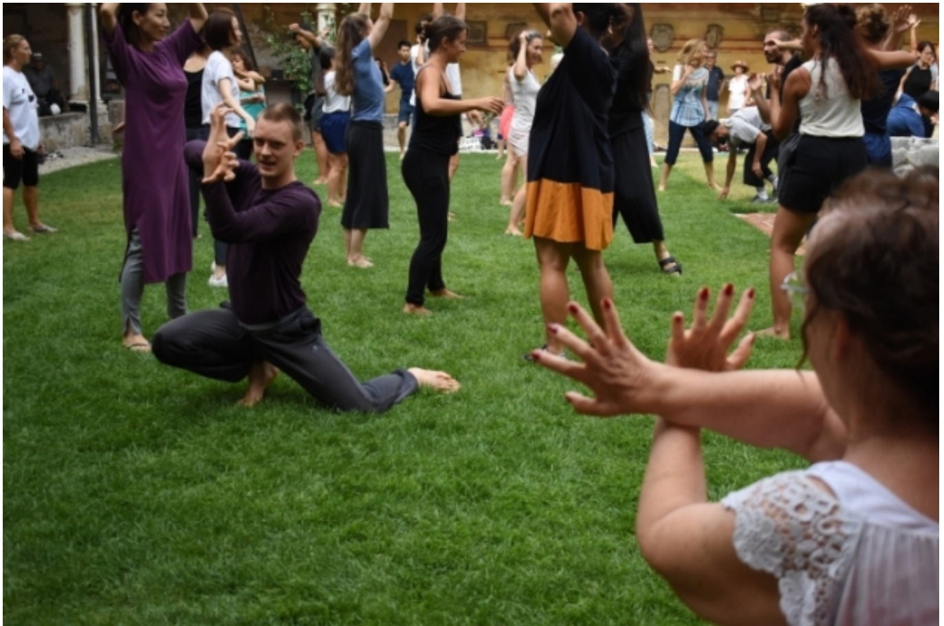
Classe Dance Well al festival B.Motion | ednetwork.eu [4]

Les connexions entre la dansa, la salut, el benestar i les cures són múltiples i inclouen una àmplia varietat d'enfocaments. En aquest sentit, el document aborda alguns dels principals termes que s'utilitzen en l'actualitat, com ara, l'artteràpia o la prescripció artística [5] en entorns sanitaris.