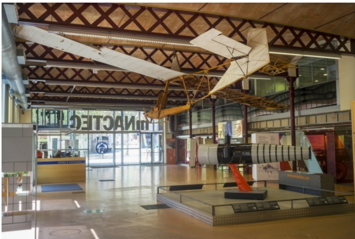
Museu Nacional de la Ciència i la Tècnica de Catalunya a Terrassa. mnactec.cat

A tall de guia pràctica , aquesta publicació obre amb la definició d'un marc conceptual sobre els equipaments museístics i aporta informació tècnica sobre la composició de les plantilles dels museus i els perfils i competències dels membres. Amb tot, donada la diversitat dels museus catalans, aquests paràmetres compten amb certa flexibilitat perquè puguin donar resposta a aquesta realitat. L'informe pretén definir els equips de gestió segons els nivells de complexitat dels equipaments.