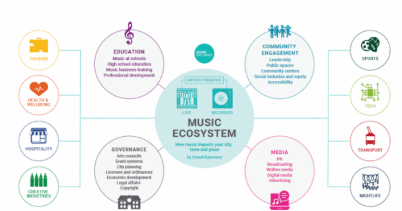
Ecosistemes musicals. Sound Diplomacy

El document, que fa una crida a la transició ecològica des de les polítiques culturals , tanca amb un decàleg d'accions clau adreçades a governs, professionals i a tota mena d'organitzacions per integrar estratègies més sostenibles.