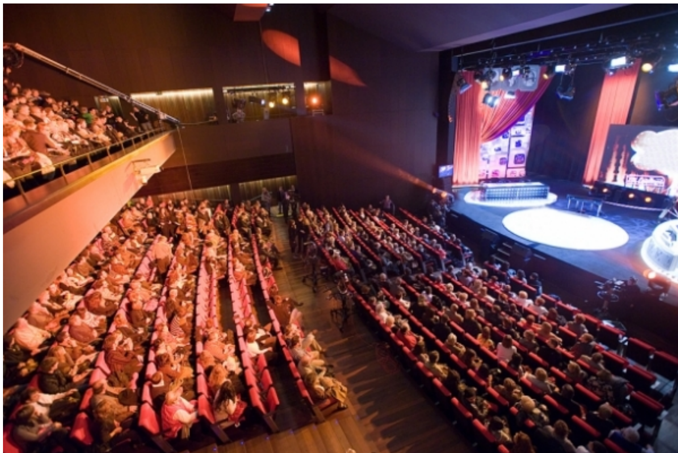
Teatre Kursaal de Manresa

Quant a la digitalització , el document llança diverses qüestions sobre les quals caldria reflexionar. Introduir enfocaments innovadors per enregistrar i veure obres en línia de qualitat, amb l'ús d'experiències en 3D visuals i sonores podria suposar un pas més enllà, però, a quins públics anirien adreçades? Quins segments quedarien exclosos, tenint en compte la bretxa digital? I, sobretot, com podria el sector participar de la configuració de les noves tecnologies , per apropiar-se-les, en comptes d'adoptar-les passivament? Són algunes de les qüestions a resoldre, car el temps passa ràpid en la lluita contra el canvi climàtic.