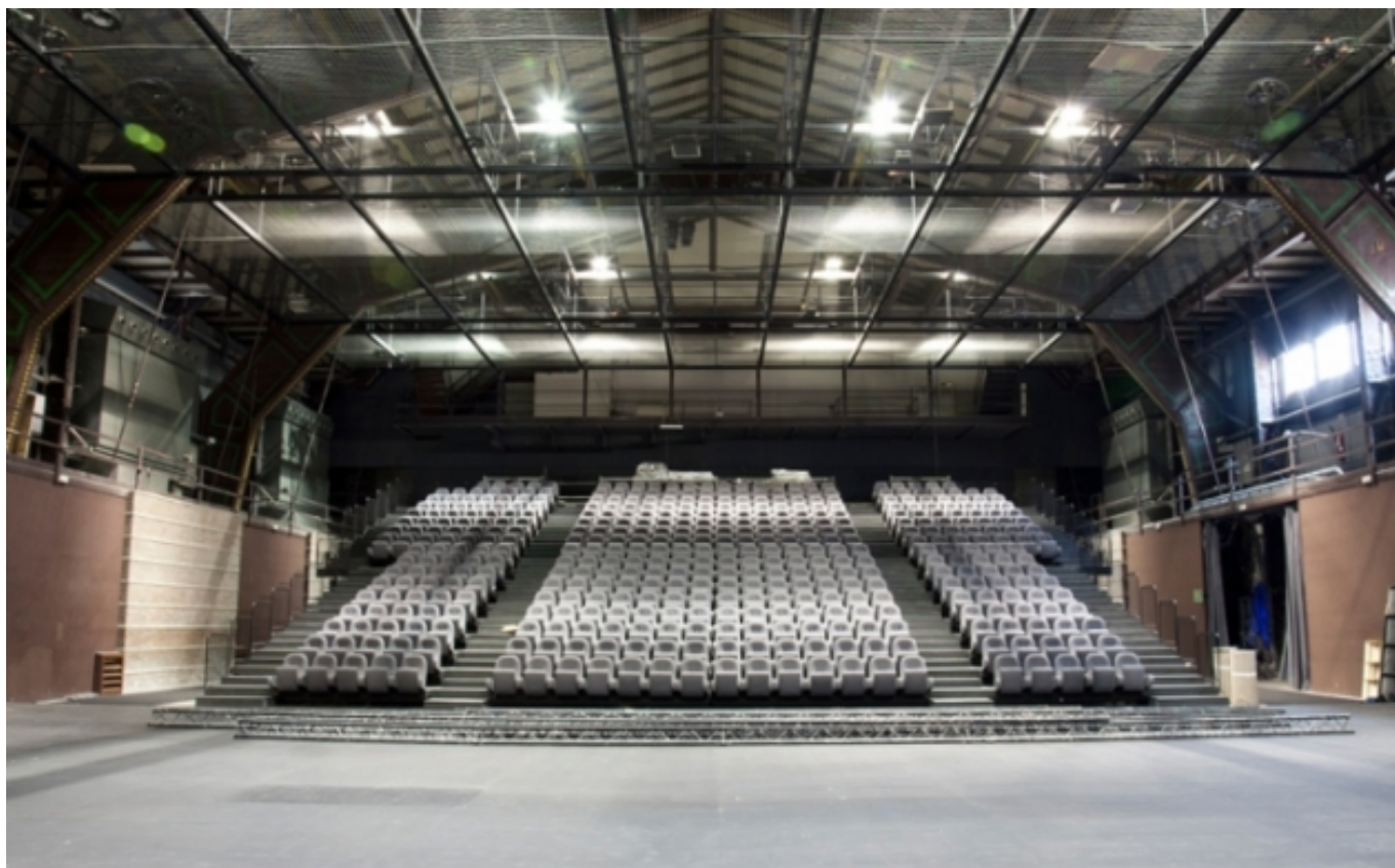
Sala Maria Aurèlia Capmany