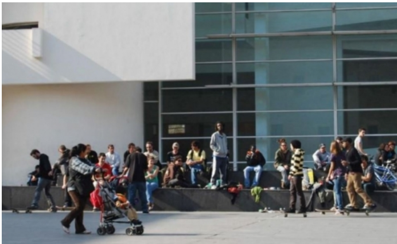
Museu d'Art Contemporani de Barcelona (MACBA) Plaça dels Àngels

Aquestes mesures, però, segons reconeix l'autor, han de fer front a una sèrie de reptes que impliquen superar obstacles previs lligats a unes competències, recursos i col·laboració política limitats, així com enfocaments a curt termini. Les possibles tensions interculturals en la comunitat i la reticència d'algunes organitzacions culturals a comprometre's amb la diversitat, s'afegeixen als possibles entrebancs identificats. A banda, l'estudi es fa ressò de l'impacte de la Covid-19 en les diverses dimensions de la vida a les ciutats, com ara les celebracions col·lectives, així com un accés a la cultura truncat per les restriccions que han amenaçat la supervivència dels artistes i professionals de la cultura.