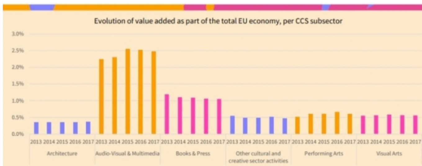
Evolució del valor afegit com a part de l'economia total de la UE, per subsector

El document, que aplica una definició molt ampliada dels àmbits dels SCC, dedica el primer bloc a una anàlisi en forma agregada per a tots els sectors a escala europea, per passar a un segon bloc que aborda cada subsector identificat: el dels llibres i la premsa, l'audiovisual i multimèdia, les arts visuals, les arts escèniques, l'arquitectura, el patrimoni, arxius i biblioteques i altres activitats no incloses en els epígrafs anteriors (lloguer d'escenografia, reparació d'instruments musicals, etc.).