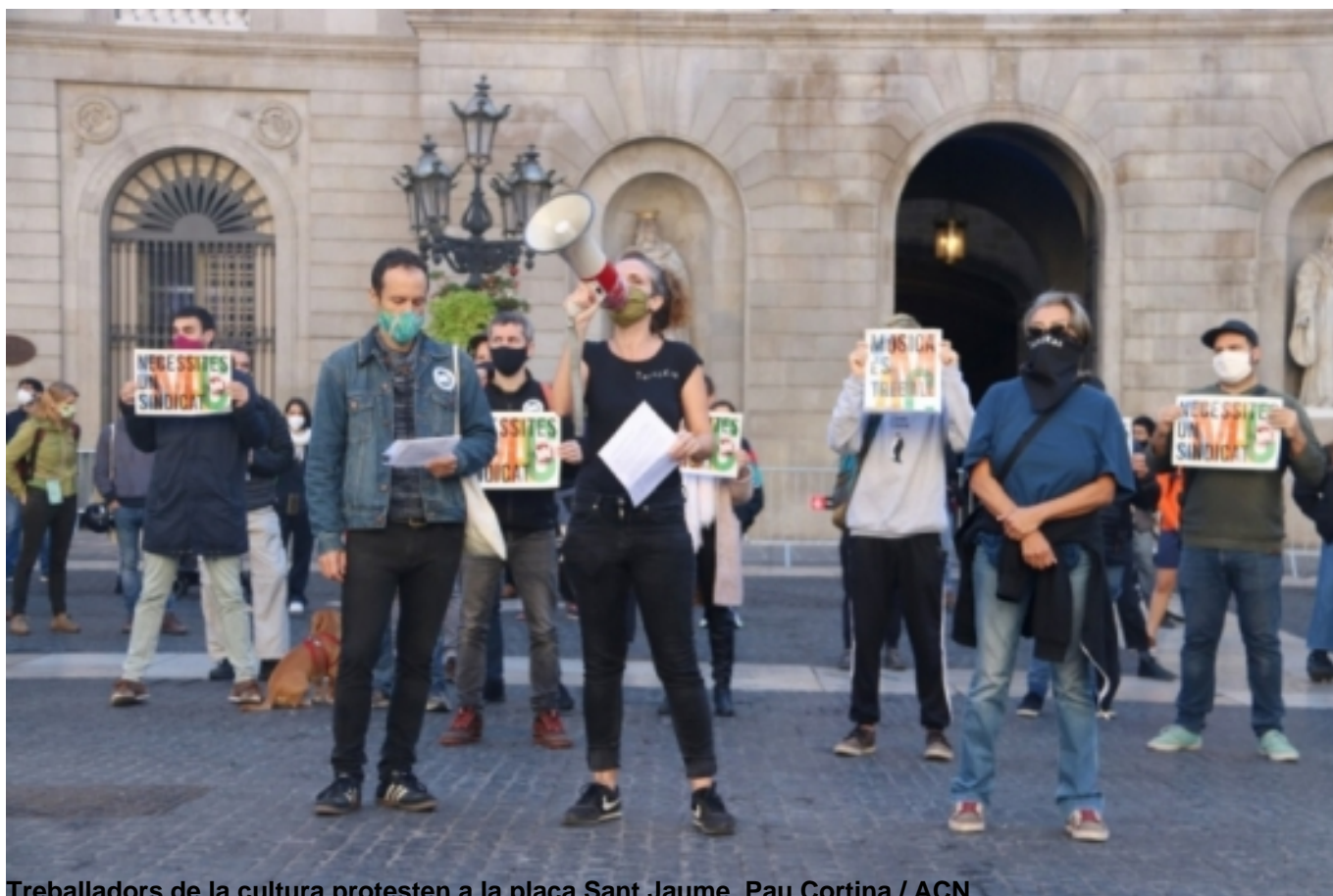
Treballadors de la cultura protesten a la plaça Sant Jaume.

Paz, Susana. (2020, 20 novembre). Les activitats culturals podran trencar el toc de queda i el confinament perimetral. Regió 7 Manresa . https://www.regio7.cat/arreu-catalunya-espanya-mon/2020/11/20/activitats-culturals-podran-trencar-toc/643376.html