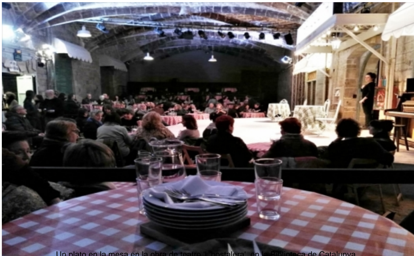
Un plato en la mesa en la obra de teatro 'El nostalera', en la biblioteca de Catalunya.

Más allá de lo que poquísimo que están haciendo las administraciones, ¿no hay sociedad civil en la cultura? (...) La creación está sometida a la indigencia. Se espera que se haga gratis. Que no se quejen demasiado, ni levanten la voz."