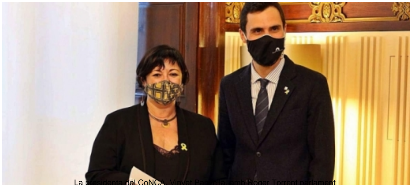
La presidenta del CoNCA, Vinyet Parçella, amb Roger Torrent parlament

Redacció. (2020, 18 novembre). 53.000 afectats per ERTO en la cultura. El PuntAvui . http://www.elpuntavui.cat/cultura/article/19-cultura/1881206-53-000-afectats-per-erto-en-la-cultura.html [15]