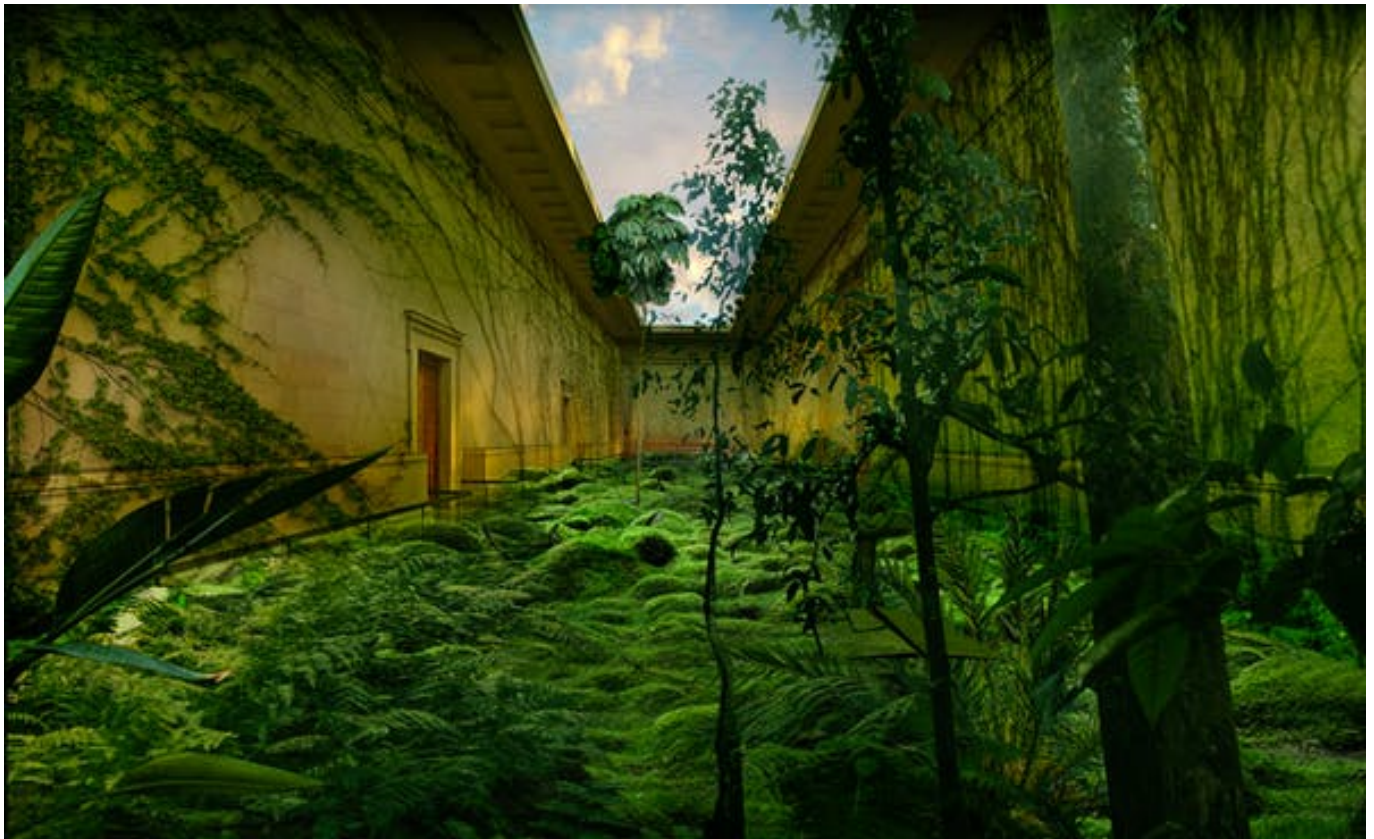
The British Museum of Decolonized Nature.