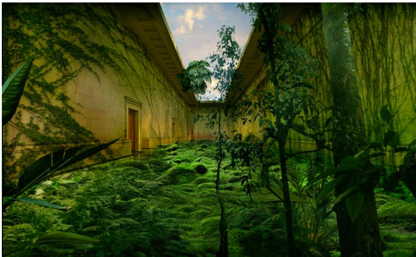
The British Museum of Decolonized Nature.