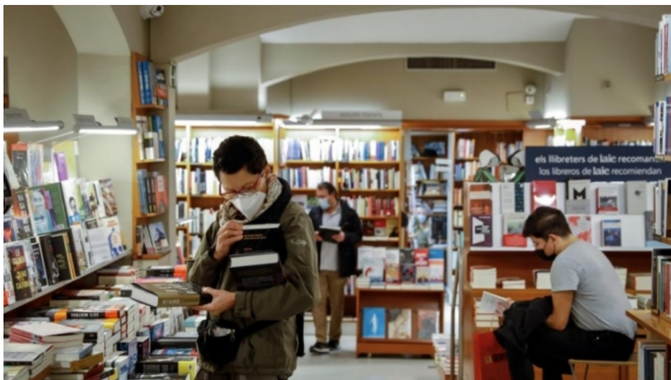
La librería Laie, de Barcelona, este lunes por la mañana. Àlex Garcia

Camps Linnell, Jordi (2020, 11 novembre). Neix Promio, la xarxa de cinemes independents. El PuntAvui . https://www.elpuntavui.cat/cultura/article/19-cultura/1877603-neix-promio-la-xarxa-de-cinemes-independents.html [8]