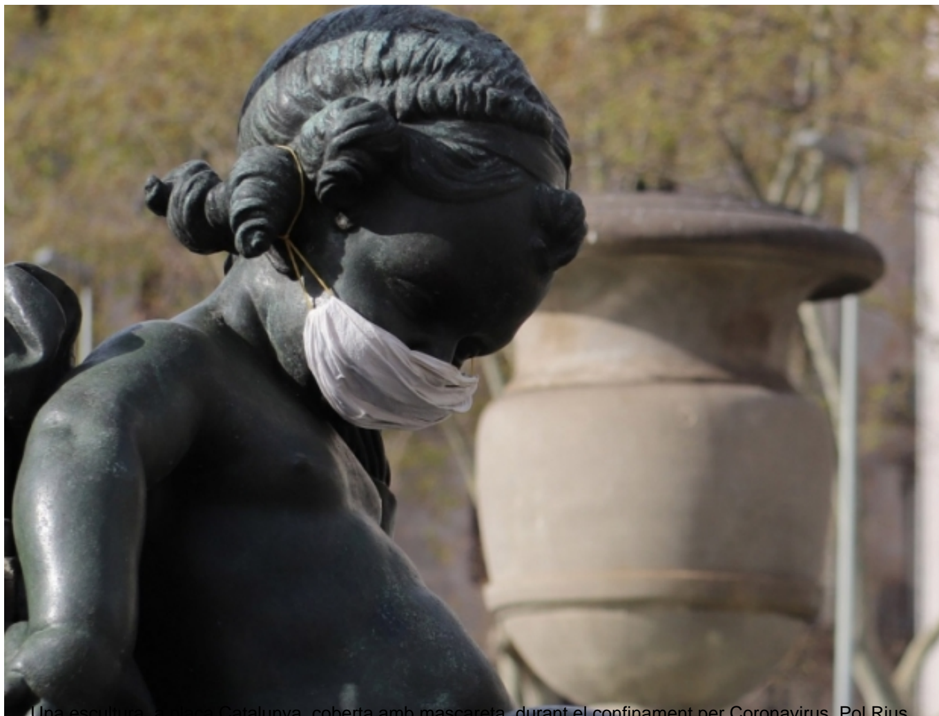
Una escultura, a Catalunya, coberta amb mascareta, durant el confinament per Coronavirus. Pol Rius

https://www.elperiodico.com/es/ocio-y-cultura/20201113/artistas-campana-twitter-actua-cultura-8201518 [3]