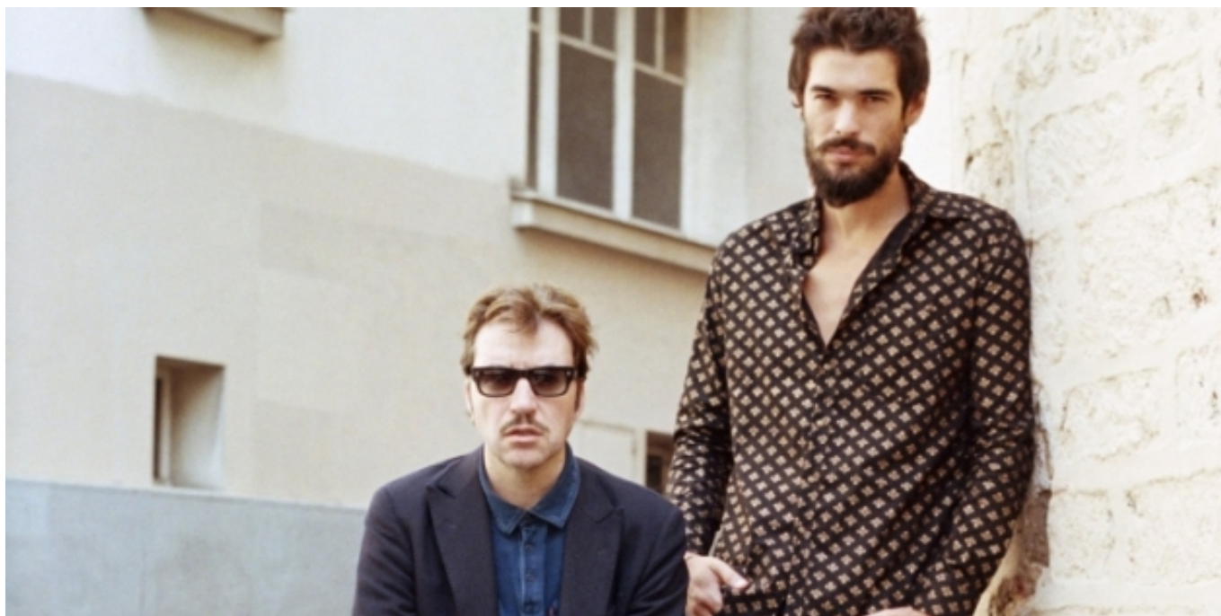
Albert Serra i Oliver Laxe: dos autors reconeguts per una estètica que sovint evita el conflicte explícit.