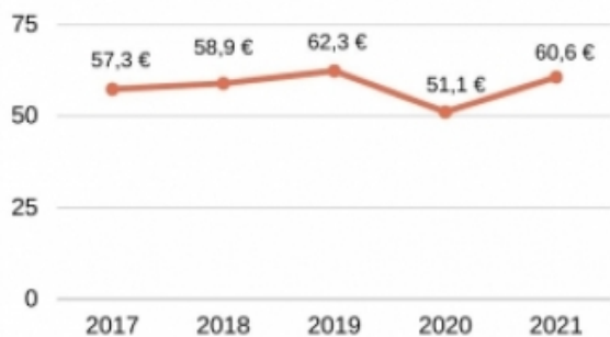
Despesa corrent del servei per habitant (€/habitant) Anys 2017 a 2021