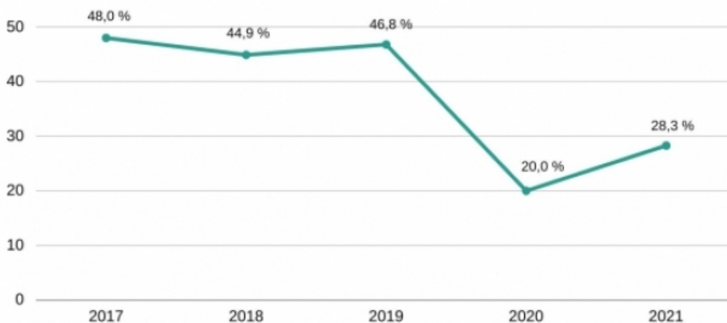
Percentatge d'entitats culturals que participen al Cicle festiu i Festivals municipals. Anys 2017 a 2021