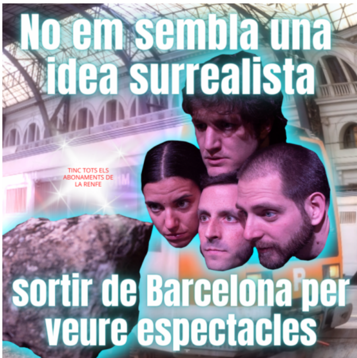
El catàleg de merdes de L'Última Merda: Memehighlights

L'Última Merda Col·lectiu, quatre joves que quan van veure que no comptaven pel sector cultural van decidir passar a l'acció, també han alertat de l'estrès que suposa intentar arribar a totes les convocatòries i subvencions que es publiquen cada mes, una conseqüència més d'aquella autoexplotació que Eudald Espluga diagnosticava en l'inici d'aquest Interacció.