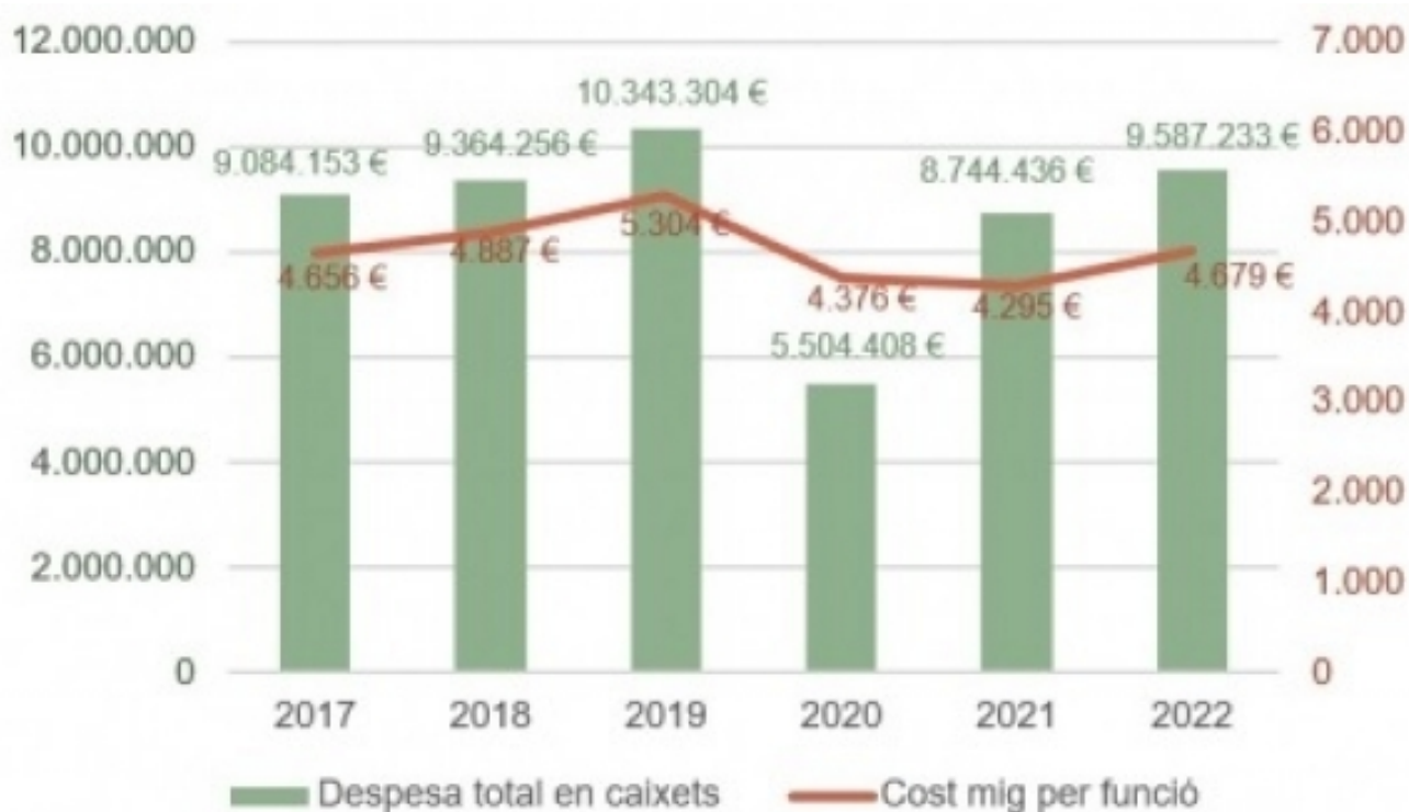
Despesa total en caixets i cost mig del caixet. 2017-2022