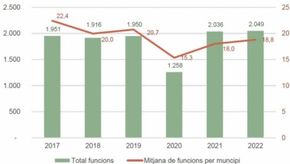
Funcions del Circuit. 2017 -2022

augmenta respecte l'any anterior, però es situa encara per sota dels valors assolits els anys precedents a la pandèmia.