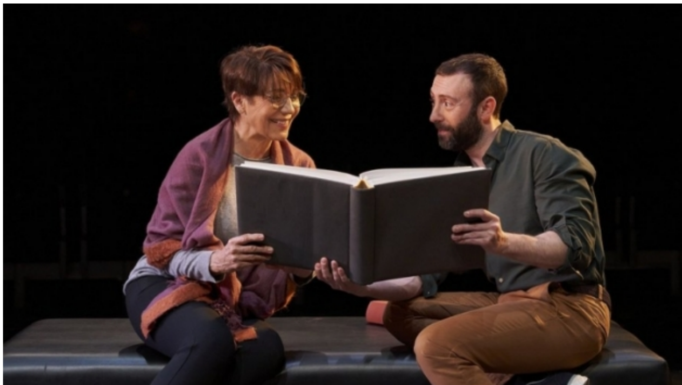
L'Oreneta, espectacle amb més assistents el 2021. La Villarroel.

Aquestes son algunes de les dades que aporten l' informe 2022 [2] de les programacions del Circuit de la xarxa d'espais escènics municipals, un programa que dona suport a la difusió de les arts escèniques i musicals professionals a l'àmbit local, en el qual han participat 109 municipis l'any 2022.