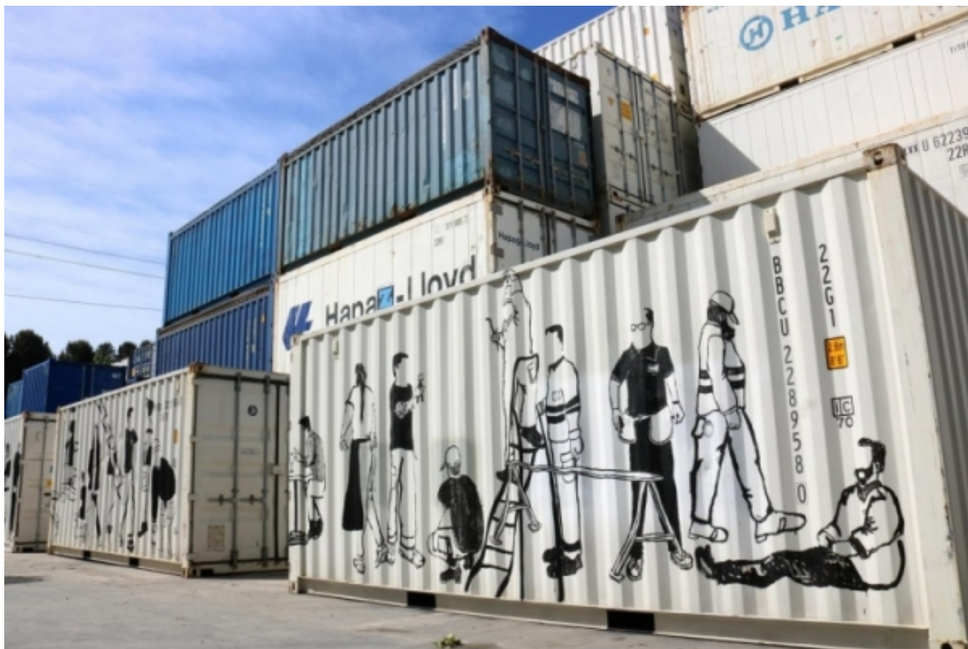
NYS Polígon Arts a la zona industrial de Castellbisbal | Clara Nubiola