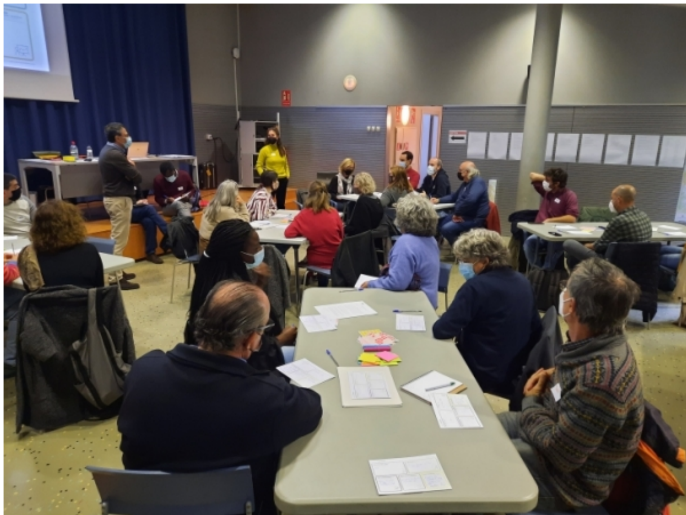
Primera reunió del Grup Ampli, 11 de novembre del 2021

innovadores, en un ampli procés participat, que ha permès obtenir resultats en diferents sessions de treball amb agents culturals, representants d'entitats locals, i electes i personal tècnic de l'Ajuntament de Granollers. El procés s'ha estructurat a partir de dos grups de treball: un Grup Motor, que ha estat el grup tractor del procés, amb representants polítics i tècnics dels serveis municipals de Cultura, Promoció Econòmica, Educació i Esports, Medi Ambient i Espais Verds, Planificació i Projectes Estratègics, així com representants d'equipaments municipals; i un Grup Ampli, conformat per 30 agents del teixit cultural i creatiu, social i econòmic local, així com ciutadania a títol individual.