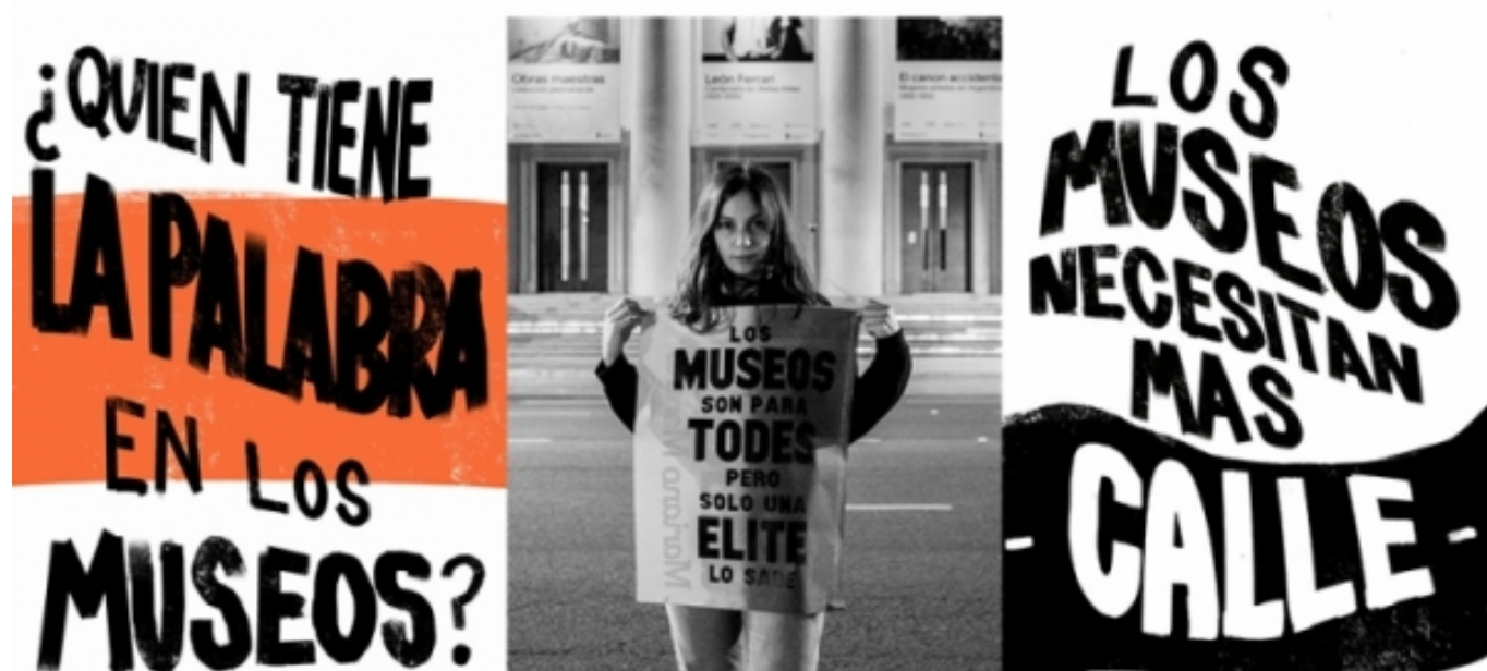
Campanya del projecte argentí "Los museos son para todas pero solo una elite lo sabe"