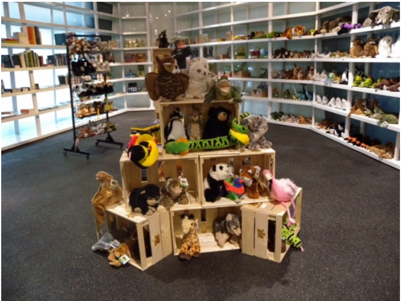
Botiga del Museu de Ciències Naturals de Barcelona