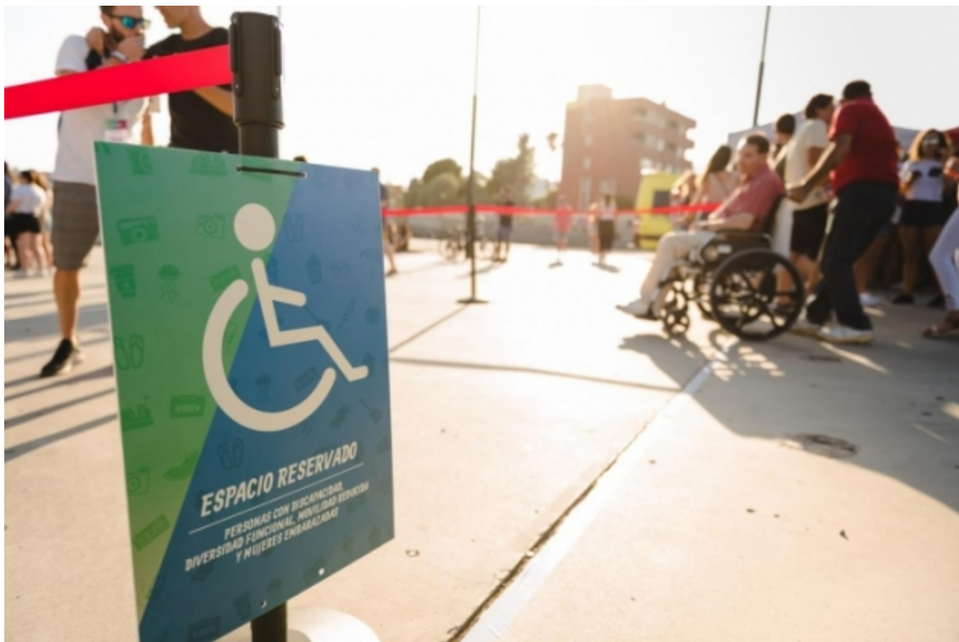
L'accessibilitat és una de les prioritats del Cooltural Fest | ONCE [32]

És clar, garantir que un museu compti amb els recursos humans necessaris i programes educatius inclusius requereix un finançament adequat. Que el 94% dels fons estatals per museus [33] els capti Madrid no és, per descomptat, una bona notícia. De fet, des de 2008, les inversions en cultura s'han recentralitzat i s'han prioritzat aquells equipaments en què el Ministeri de Cultura i Esport participa en forma de patronat. A Barcelona, l'exemple més evident és el Liceu, que es queda la major part dels milions que l'Estat dedica a cultura a Catalunya. La cultura ha de tenir més d'un epicentre per sacsejar per igual tot el territori. Precisament, la trobada " Museo prosaico: Norma, praxis, precariedad [34]" ha reflexionat sobre el biaix ideològic dels processos i consensos institucionals que impedeix l'harmonització d'interessos entre institució i comunitats. Un exemple: les traves contractuals, fruit de la tendència reburocratitzadora de l'administració, dificulten el dia a dia dels equips dels museus.