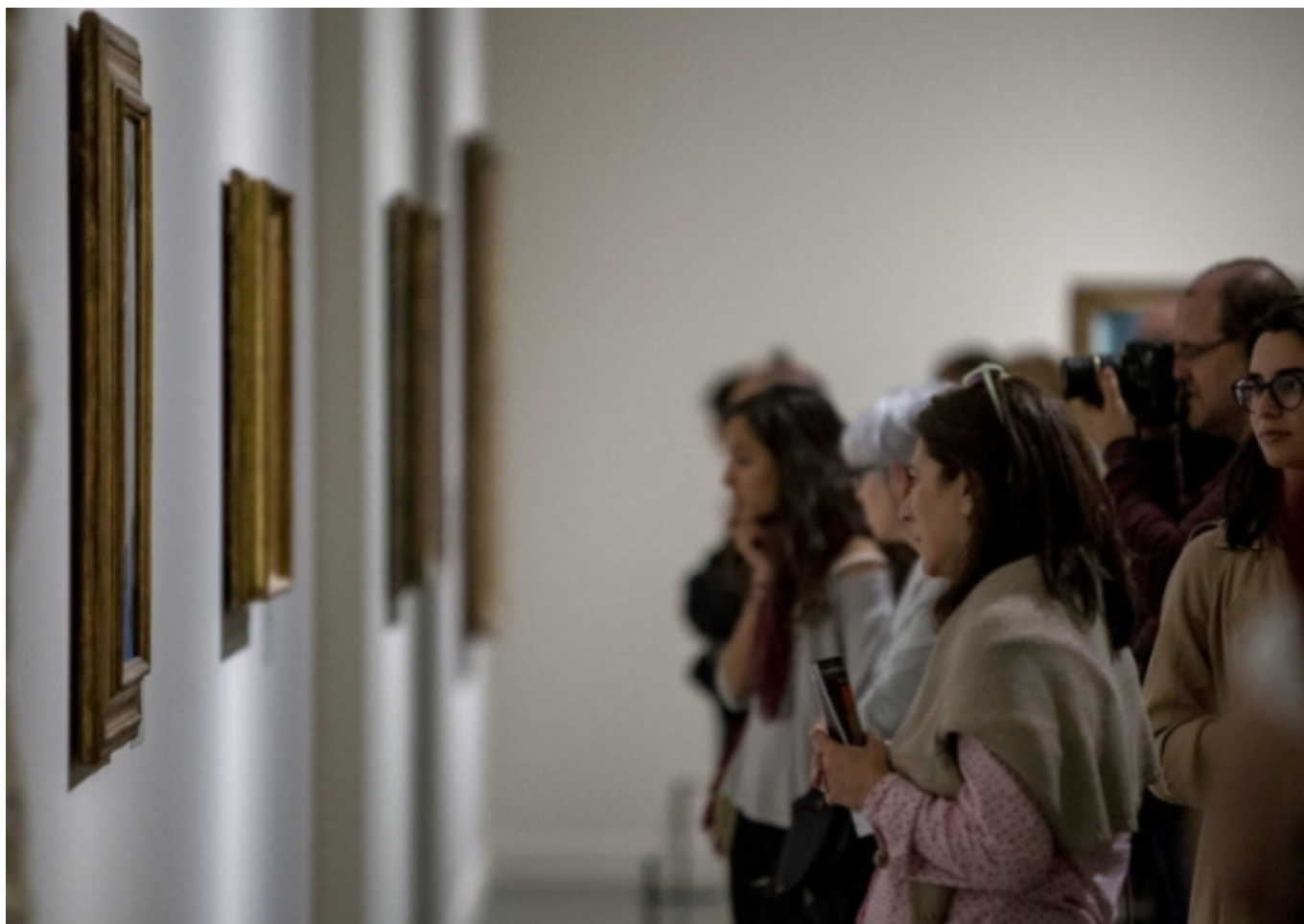
Visitants d'un museu d'art | Albert Salamé, El Punt Avui [22]

Un dels epicentres de la geologia cultural són els museus. Un trimestre més, han tingut un protagonisme especial a Interacció. Recordem que en època de restriccions han estat una alternativa a l'activitat turística. Així, els espais museístics del territori s'han vist afavorits pel turisme de proximitat. A més, el fet de tenir restringides la mobilitat i la vida social ha propiciat que es tripliquessin les visites en solitari als museus. És probable que les afectacions de la pandèmia en la salut mental [20] de la població hi tinguin a veure. En aquest sentit, els museus, però també la cultura en general, poden ser una vàlvula de descompressió emocional. S'ha comprovat que l'estat anímic condiciona la decisió de visitar, o no, un museu durant la pandèmia. Segons un estudi del Ministeri de Cultura i Esport [21], la gent que visita museus afirma estar més animada. Causa o conseqüència? Si més no, queda clar que vida emocional i vida cultural són indissociables. I per aquest motiu cal que els museus creïn nous relats que afavoreixin la reflexió sobre els escenaris de l'era postpandèmica.