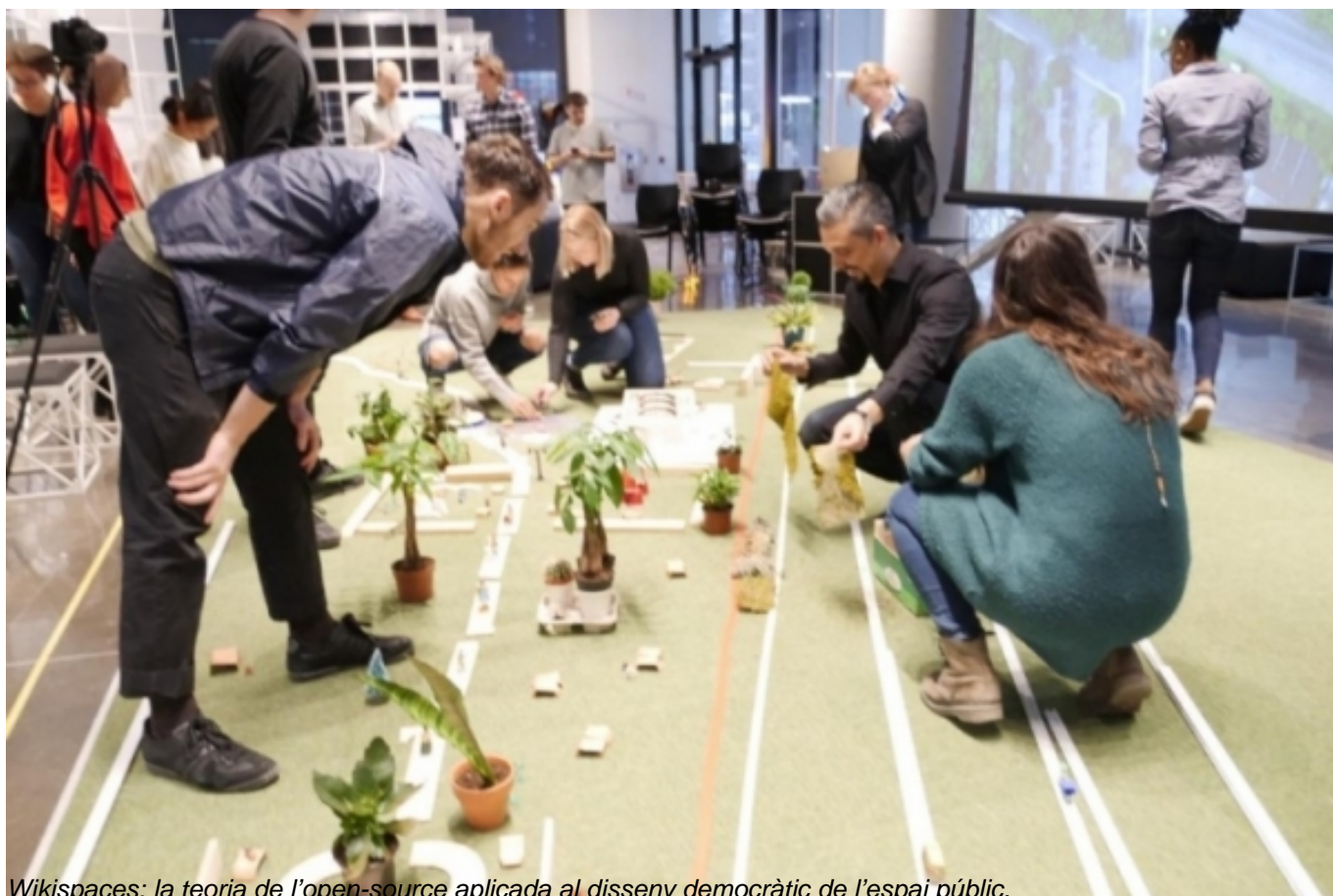
Wikispaces: la teoria de l'open-source aplicada al disseny democràtic de l'espai públic.