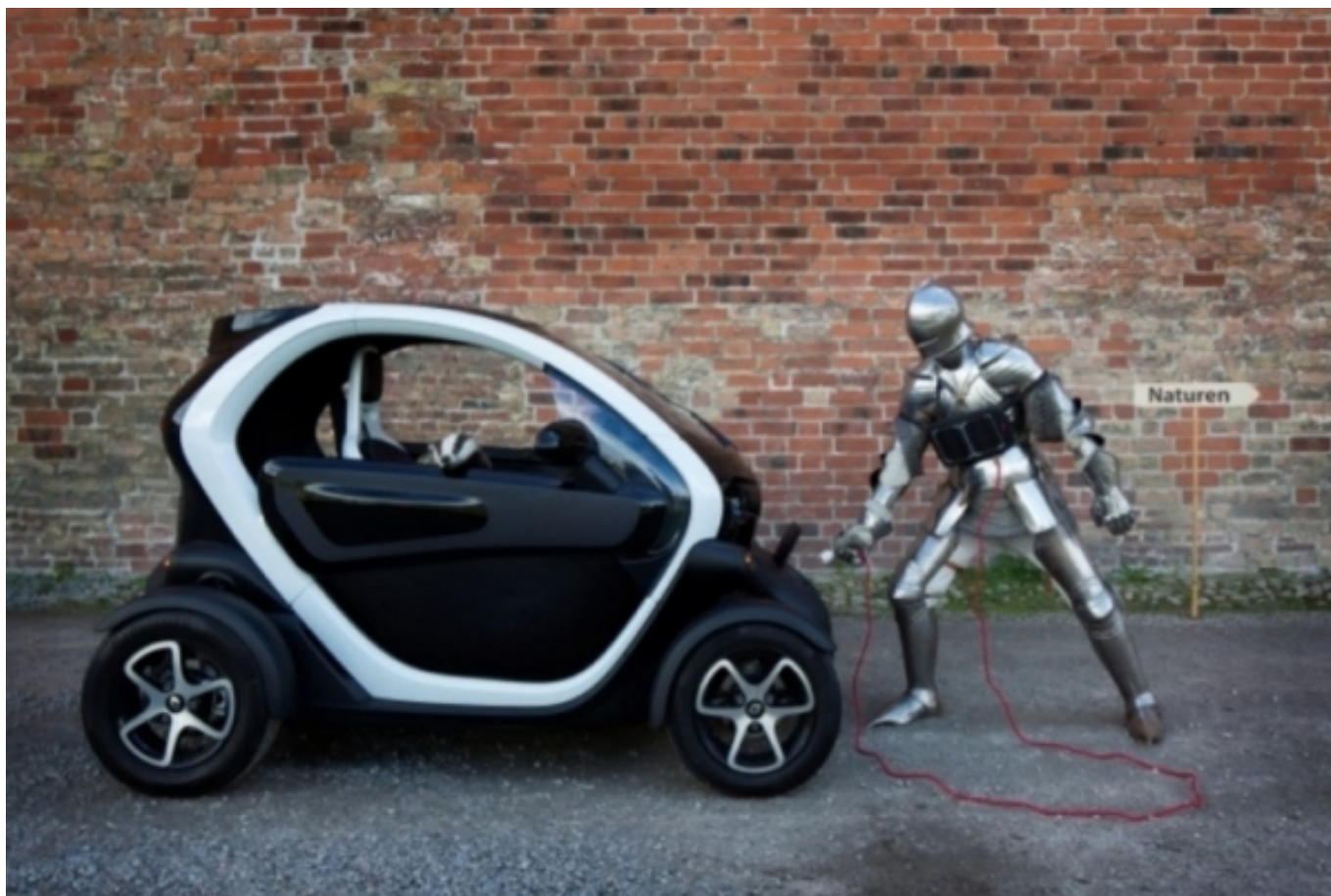
Fotografia que il·lustra l'estratègia cultural "L'Ànima de Malmö" com a bona pràctica de l'Agenda 21 de la cultura.