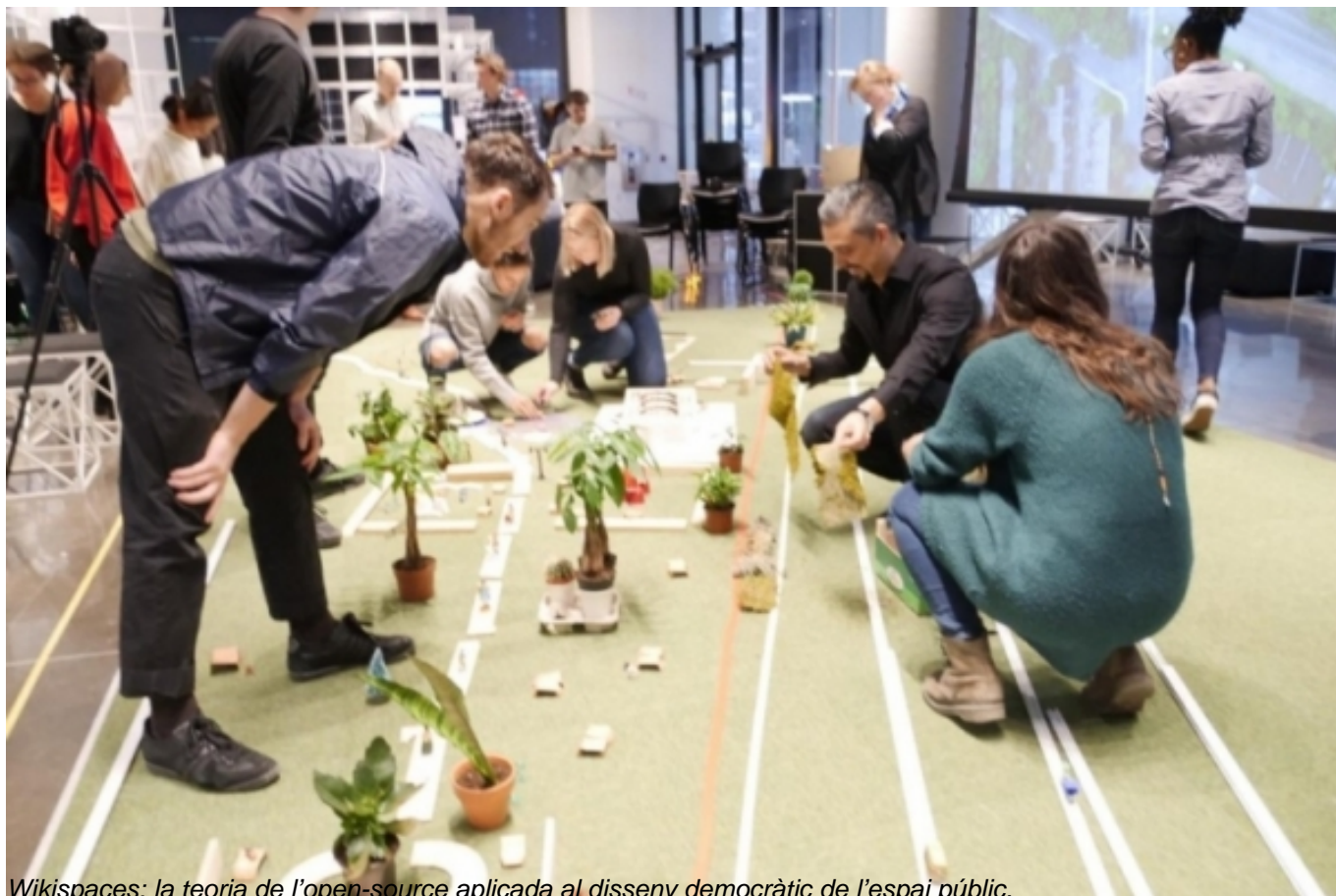
Wikispaces: la teoria de l'open-source aplicada al disseny democràtic de l'espai públic.

(Bonet, Carnelli, Calvano, Dupin-Meynard, Nègrier i Zuliani, 2020) i incloure els actors culturals en el seu disseny i en la planificació urbana.