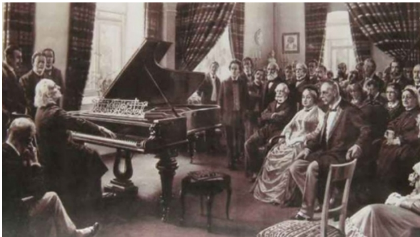
Franz Liszt en un dels seus concerts (anònim)