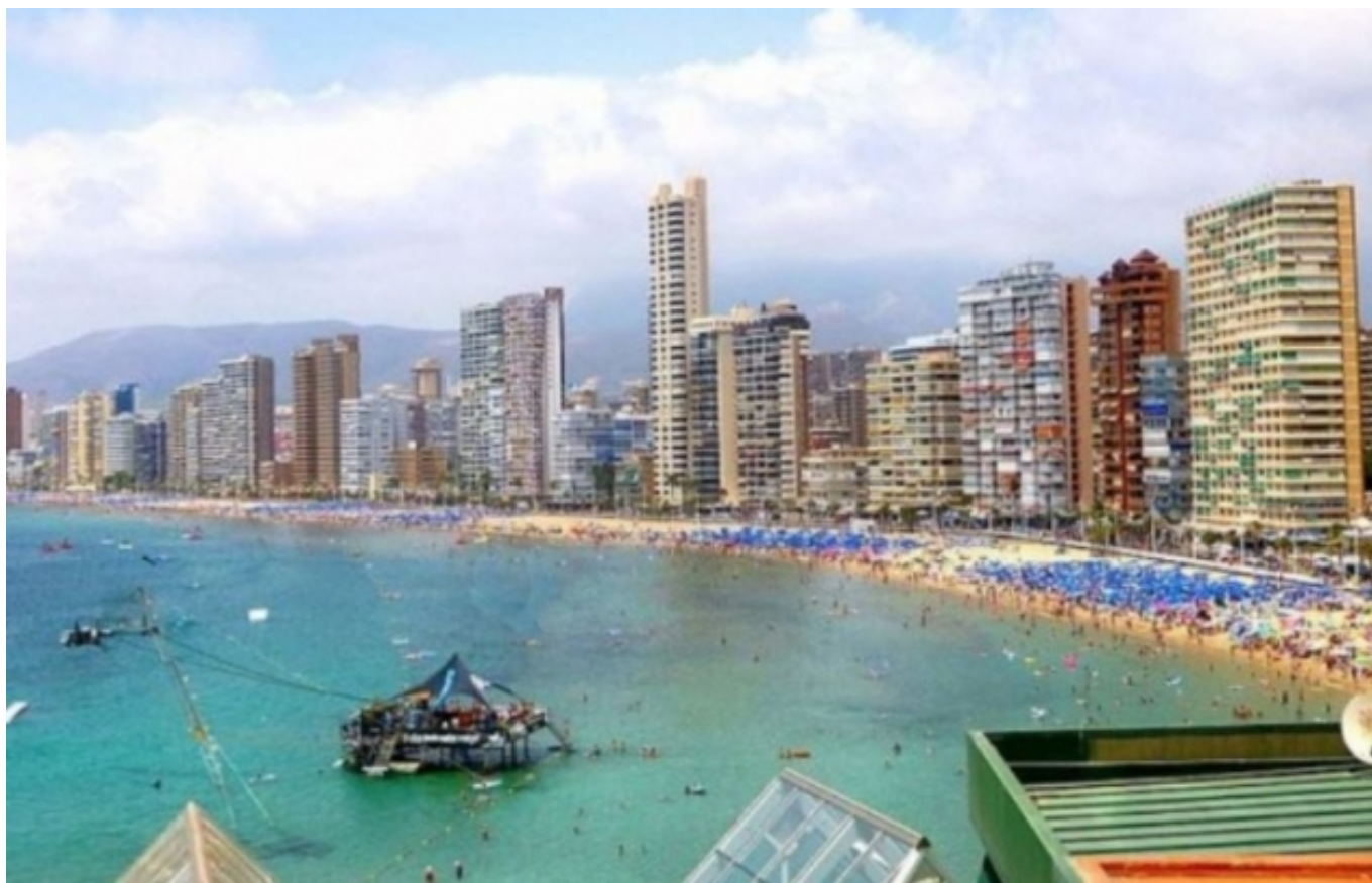
Paisatge de la platja de Ponent de Benidorm

Partint d'una cultura actual més familiaritzada amb la tecno-diversitat que amb la biodiversitat, el projecte analitza com els múltiples paisatges ( landscapes, cityscapes, skyscapes, etc. ) ens condicionen, estudiant la relació de múltiples tipologies de comunitats amb aquests espais, des de poblacions urbanes i rurals occidentals, fins a les cultures del desert o els habitants de la selva.