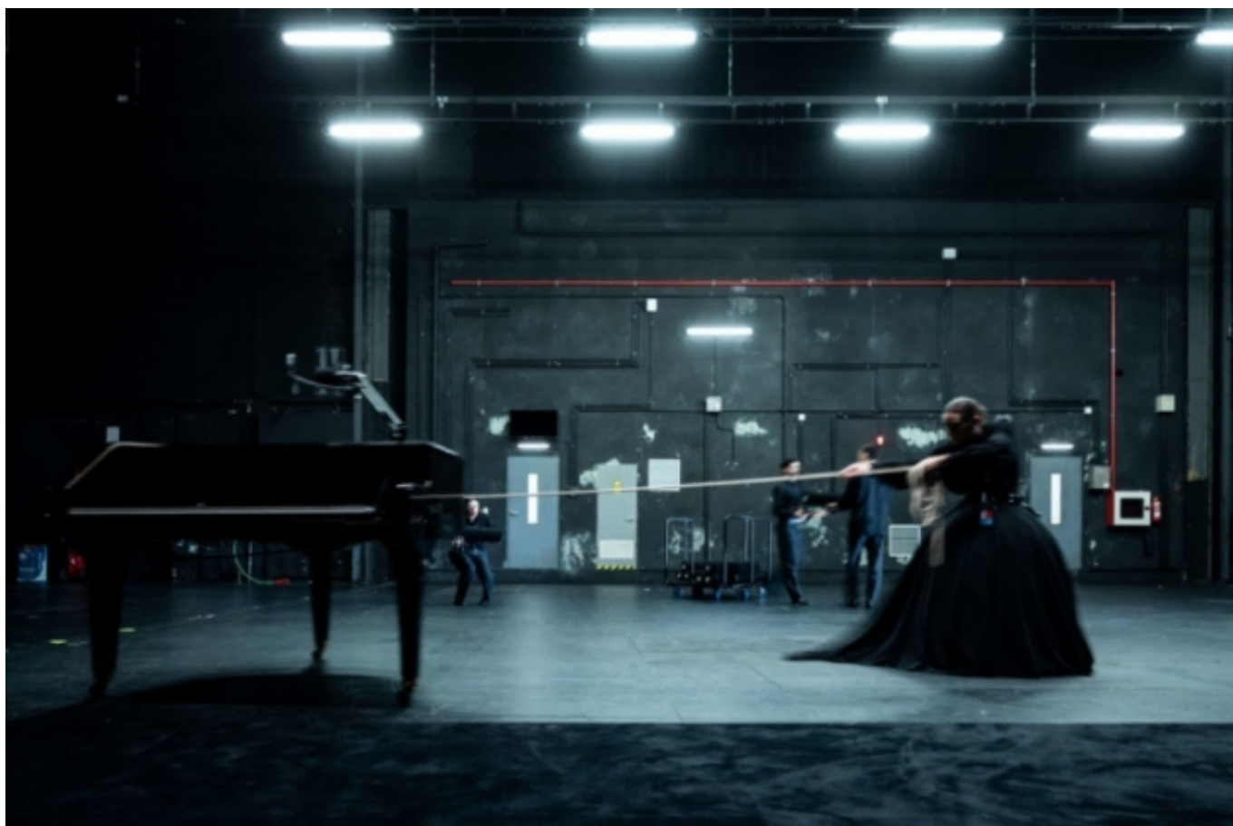
'Opening night', de La Veronal, ha esgotat entrades al TNC

Gomila fa una crida perquè els teatres públics prioritzin aspectes com la qualitat dels espectacles que es programen, acompanyar els joves talents o garantir l'accés amb altra política de preus: “no podríem fer que les entrades dels teatres públics costessin el que val entrar al Macba o al CCCB, per exemple?”.