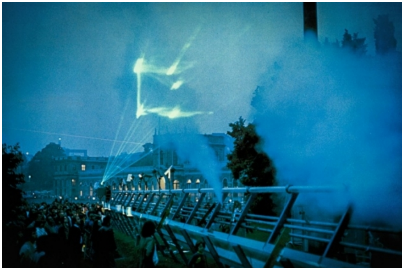
Centerbeam : instal·lació d'art-ciència icònica al MIT, 1977.

Els científics troben en els artistes visuals i dissenyadors el suport que necessiten per comunicar el seu treball a noves audiències i per establir connexions emocionals que milloren l'aprenentatge. Aquestes relacions, però, també s'estableixen en l'ordre invers, com il·lustra aquest article amb l'experiència de Les Quatre Estacions de Vivaldi a l'Orquestra Simfònica de Sydney.