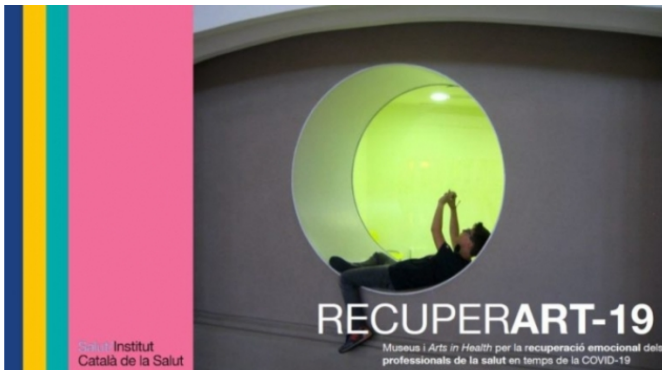
Recuperarart-19, iniciativa de l'Institut Català de la Salut i del Departament de Cultura

Belfiore, E. (2021, 17 febrer). A moral failure in cultural policy [5]. Arts Professional https://bit.ly/3gKd8rX [6]