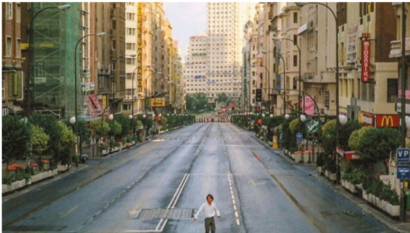
La Gran Vía de Madrid a 'Abre los ojos' (1997)

A fora, el decorat que hem vist, era ben difícil d'aconseguir. Carrers deserts, de cotxes i pràcticament de qualsevol forma de vida humana, com ja havíem vist a "Abre los ojos" o "Los últimos días".