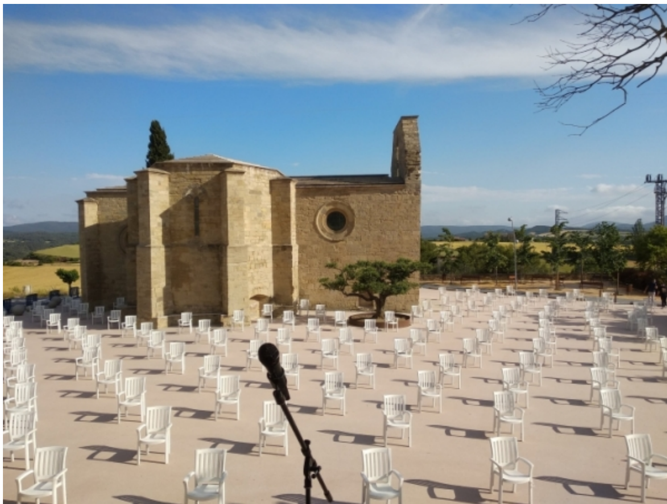
Festival Maig de Santa Coloma de Queralt. [6].