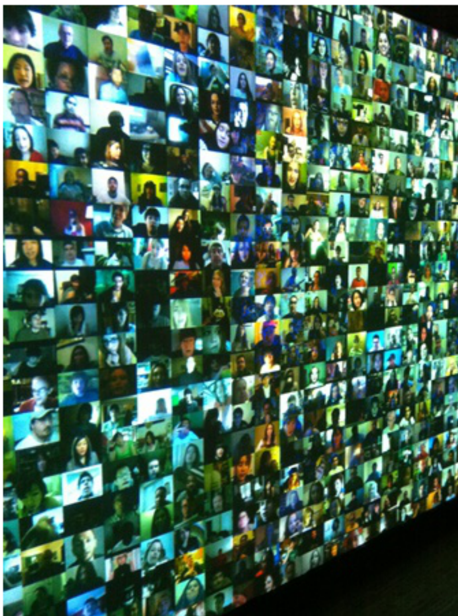
El paper de les institucions