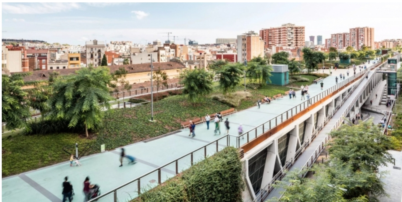
Jardins de la Rambla de Sants de Sergi Godia

Segons la investigadora, hi ha maneres per assolir els beneficis del verd sense incórrer en la gentrificació. Les solucions inclouen més habitatge social (Barcelona té un percentatge deu vegades inferior al dels països europeus més avançats); control del preu de lloguer en certs punts crítics (Berlin, París, Nova York i San Francisco apliquen mesures d'aquest tipus); cooperatives d'habitatge; o models com el "community land trust", on una organització sense ànim de lucre és propietària de la terra, que s'aplica al barri de Dudley de Boston.