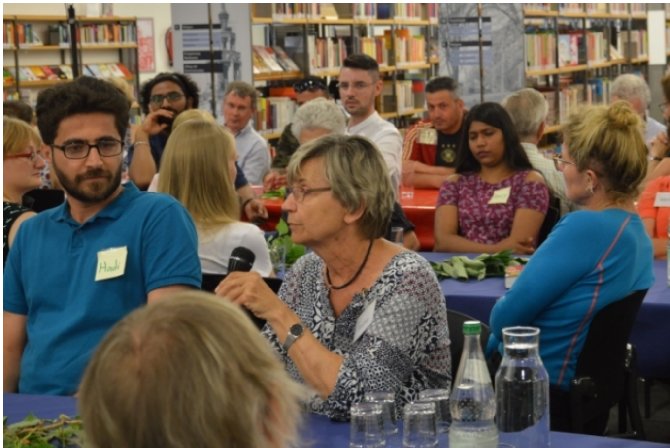
Projecte Treffpunkt Deutsch [3] de la biblioteca de la ciutat de Heilbronn, Alemanya

Malgrat que, a priori, sembla que les biblioteques poden contribuir a complir segons quins objectius mentre que són poc adients per abordar-ne d'altres, l'informe contradiu aquest argument mitjançant un entenedor exemple basat en l'Objectiu 2 (fam zero). Els casos de desnutrició, inseguretats alimentària, malnutrició i retràs del creixement a Europa són pocs en relació amb altres indrets del món, fet que ens podria portar a considerar que les biblioteques europees tenen molt poc a aportar en relació amb aquest objectiu. Això no obstant, l'informe considera que la lluita contra la obesitat també pot convertir-se en una prioritat per a les biblioteques europees les quals, amb l'ajuda d'altres agents, podrien iniciar activitats de sensibilització i esdeveniments de formació amb l'objectiu de debilitar els mals hàbits nutricionals entre els usuaris de les biblioteques.