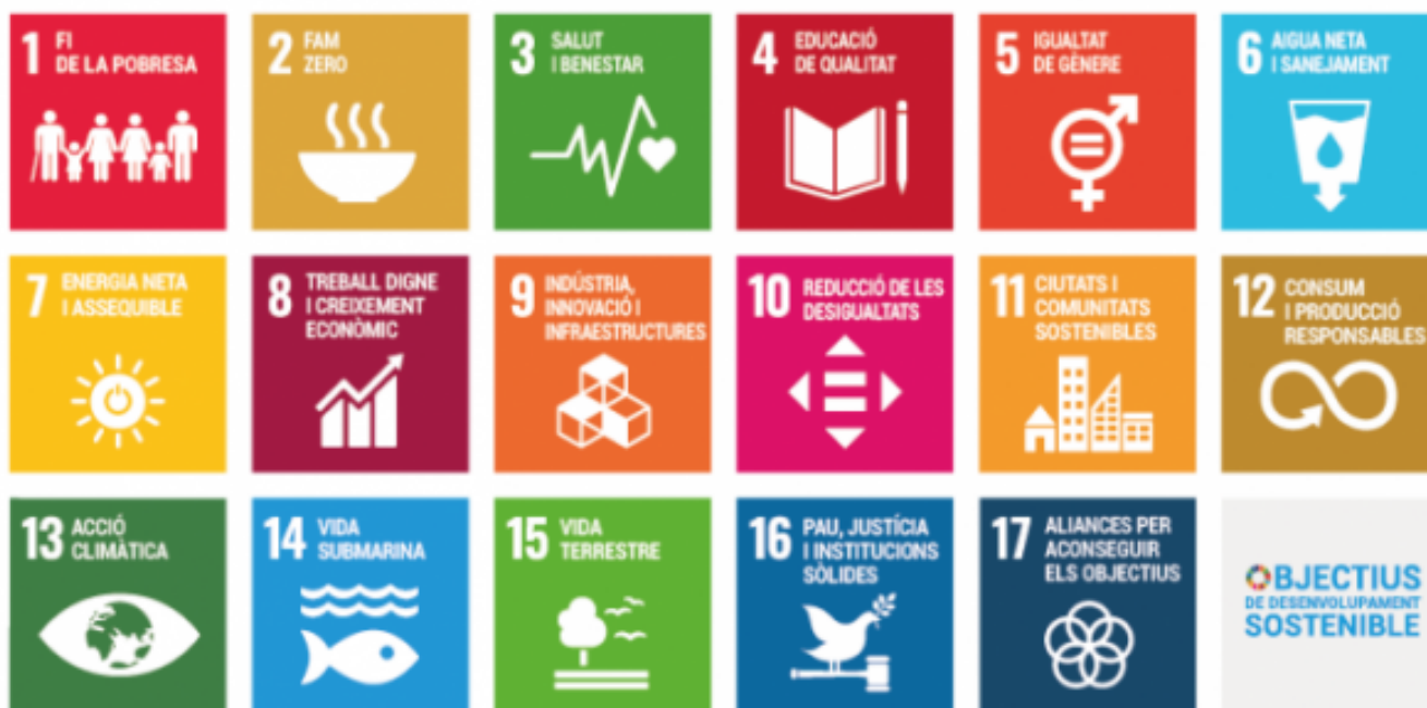
Objectius de desenvolupament sostenible (ODS)

Tradicionalment, les biblioteques han tingut el monopoli quant a la transmissió d'informació i coneixement de forma gratuïta. En el context actual, en què els gegants de la tecnologia com Google, Amazon, Facebook i Apple estan capgirant la situació, ha arribat el moment per les biblioteques d'assumir nous rols i de reinventar-se . Segons l'informe d' EBLIDA (2020) una bona manera d'aconseguir-ho és vincular la seva tasca amb els Objectius de Desenvolupament Sostenible [2] (ODS) i l'Agenda 2030.