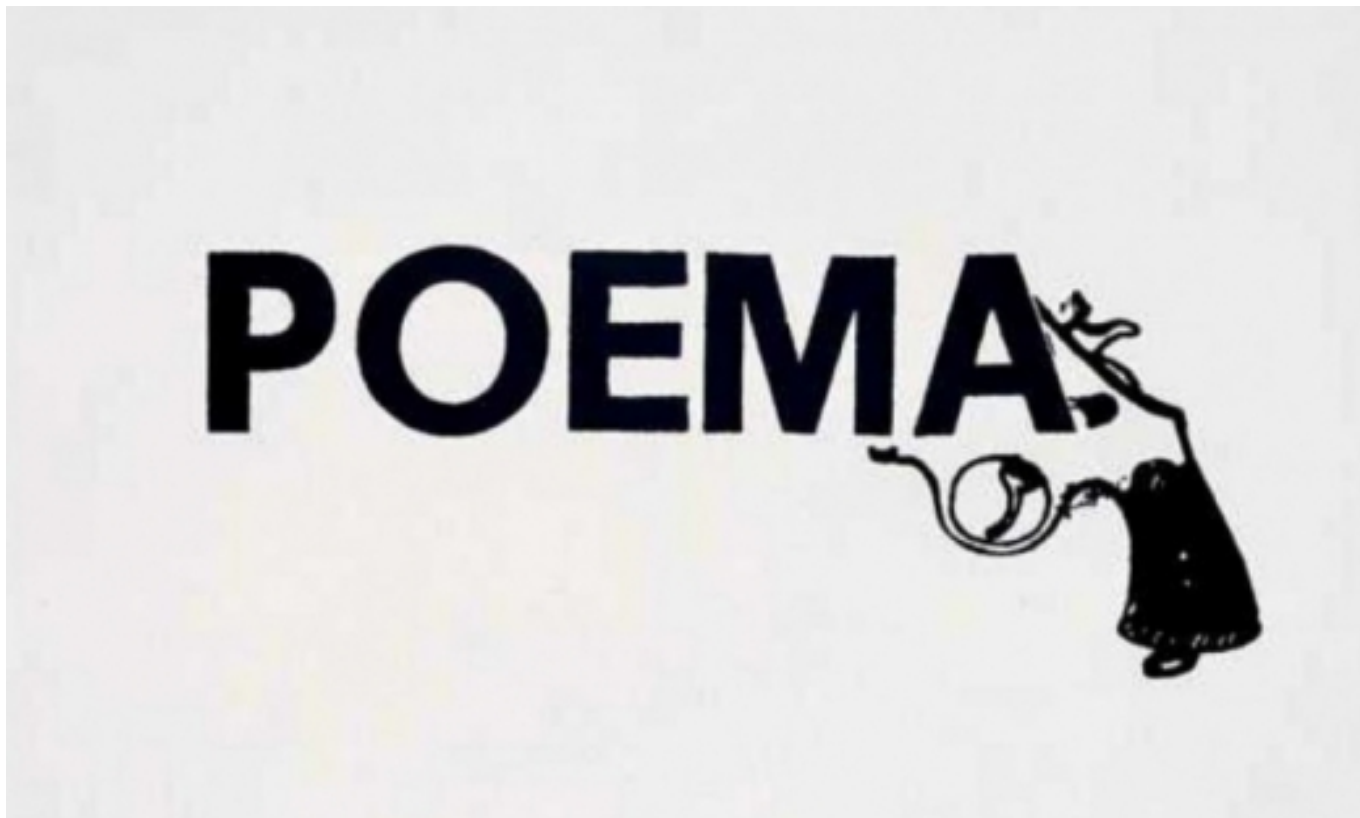
Poema visual , 1978. Brossa.

Els mots tenen la virtut de guanyar valors quan s'acompanyen d'altres mots. De la mateixa manera que les persones quan ens trobem podem sumar i crear més significats o aprendre i formar noves sonoritats. Com els passa als mots però, la mètrica de vegades ens pot separar fins arribar a l'extrem d'aïllar-nos. És en aquest punt, quan el mot es troba allunyat de tot i tothom, que viu encara més intensament la necessitat de dir i significar-se, de trobar-se fins formar part d'un poemari.