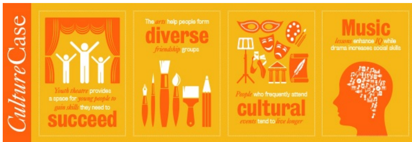
Infografia feta en motiu del primer aniversari de Culture Case | CultureCase

Com tracten d'aconseguir aquest propòsit? Presentant tots i cadascun dels documents mitjançant un resum previ, de no més de 300 paraules. Si bé és cert que el disseny d'aquest lloc web és força acadèmic i poc atractiu i intuïtiu, l'estil d'aquests resums s'inspira en l'esperit divulgatiu i en la llegibilitat dels articles periodístics , i tracta els continguts més rellevants de cada document, així com les seves principals conclusions. Per tant, és especialment a través d'aquests resums que més s'apropen a la seva intenció de fer accessible la recerca acadèmica.