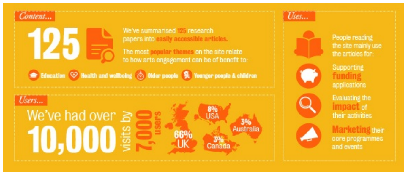
Infografia feta en motiu del primer aniversari de Culture Case | CultureCase

Com tracten d'aconseguir aquest propòsit? Presentant tots i cadascun dels documents mitjançant un resum previ, de no més de 300 paraules. Si bé és cert que el disseny d'aquest lloc web és força acadèmic i poc atractiu i intuïtiu, l'estil d'aquests resums s'inspira en l'esperit divulgatiu i en la llegibilitat dels articles periodístics , i tracta els continguts més rellevants de cada document, així com les seves principals conclusions. Per tant, és especialment a través d'aquests resums que més s'apropen a la seva intenció de fer accessible la recerca acadèmica.