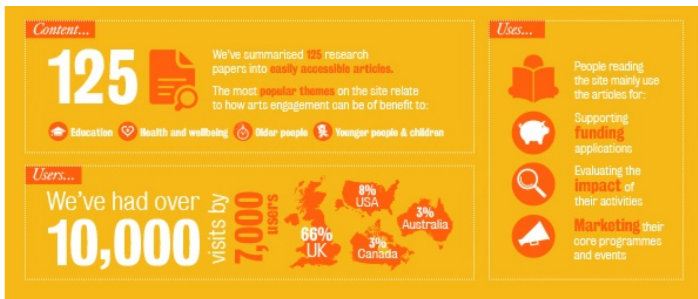
Infografia feta en motiu del primer aniversari de Culture Case | CultureCase

Com tracten d'aconseguir aquest propòsit? Presentant tots i cadascun dels documents mitjançant un resum previ, de no més de 300 paraules. Si bé és cert que el disseny d'aquest lloc web és força acadèmic i poc atractiu i intuïtiu, l'estil d'aquests resums s'inspira en l'esperit divulgatiu i en la llegibilitat dels articles periodístics , i tracta els continguts més rellevants de cada document, així com les seves principals conclusions. Per tant, és especialment a través d'aquests resums que més s'apropen a la seva intenció de fer accessible la recerca acadèmica.