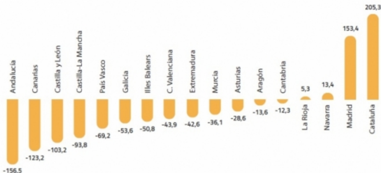
Gráfico 6. Incremento o descenso de personal ETC en bibliotecas públicas, de 2010 a 2016.

5.- L'evolució pressupostaria no sembla haver respost a uns criteris definits i ha posat en relleu que: