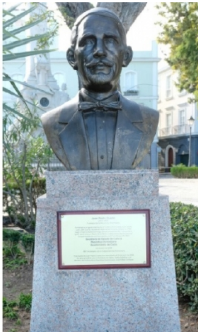
Bust de Juan Pablo Duarte