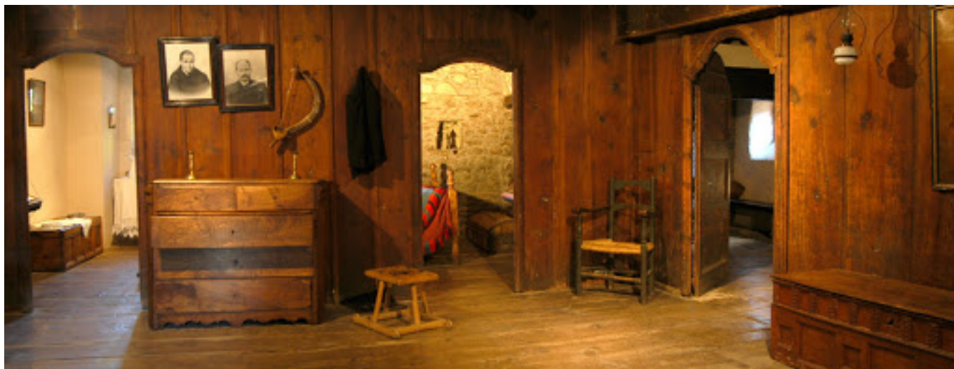
Ecomuseu de les Valls d'Àneu

El text d'Òscar Navajas [13] complementa el debat presentant la cultura com un procés de relacions i la institució cultural (més concretament el museu) com l'encarregada de gestionar-les . Això no és nou, apunta, sinó que aquesta forma de gestió es porta produint des dels anys 70 i 80 a través de la Nova Museologia . Darrerament s'han tornat a potenciar aquests models de participació i innovació des de la vessant social, i l' Espacio Vecinal Arganzuela (EVA) [14], l' Ecomuseu de les Valls d'Àneu [15] o la xarxa Cubo Verde [16] en són alguns exemples.