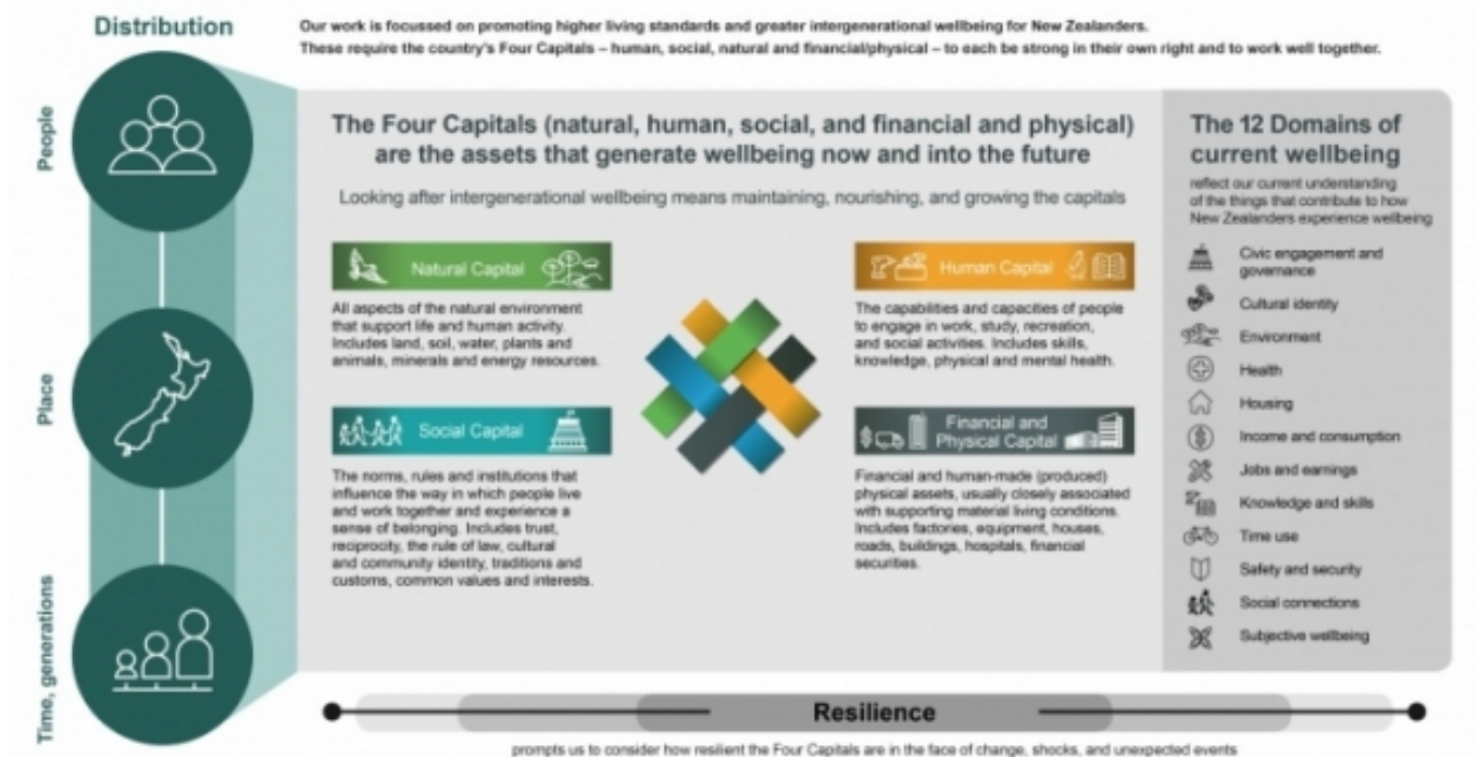
Representació del marc de qualitat de vida, dissenyat per la hisenda neozelandesa

The Treasury's Living Standards Framework (Dalziel et al., 2019a, p. 82)