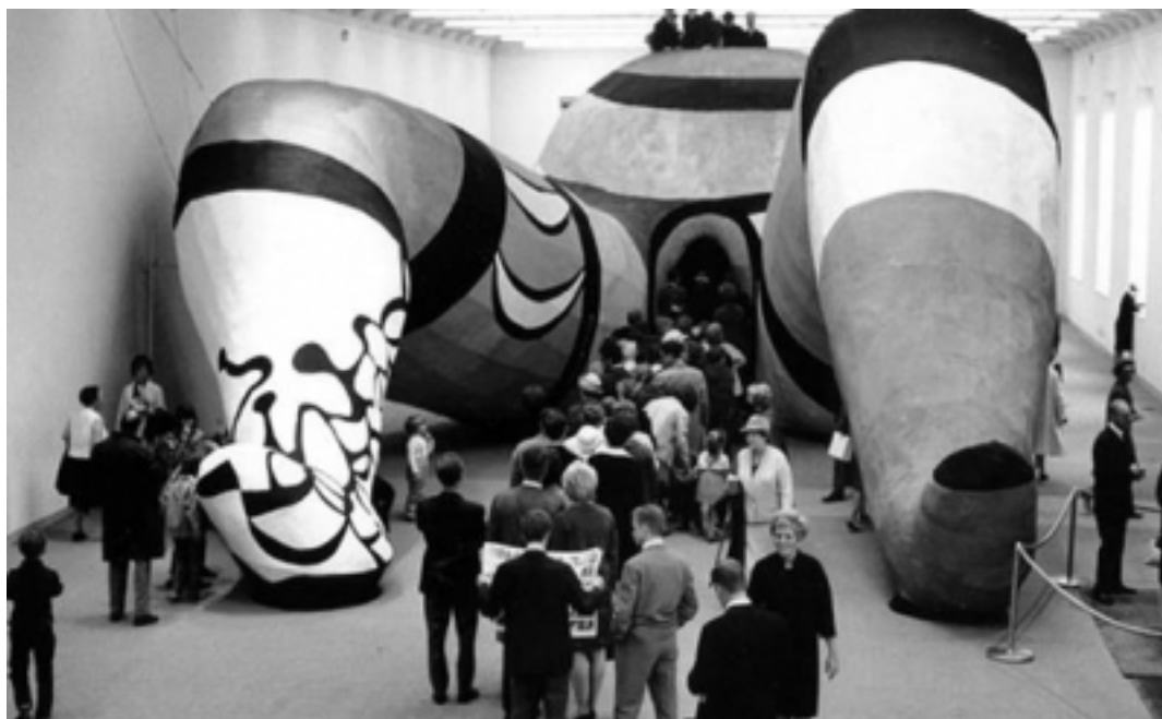
Ella (1966) Niki de Saint-Phalle

D'aquest recull artístic, algunes de les reflexions que van sorgir van ser: