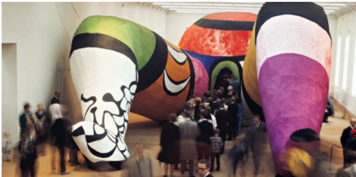
Ella (1966) Niki de Saint-Phalle

D'aquest recull artístic, algunes de les reflexions que van sorgir van ser: