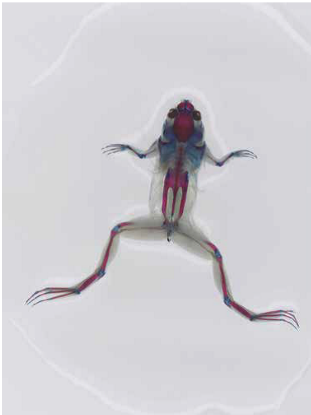
Projecte de la organització catalana Quo Artis

En definitiva, aquest compendi permet entendre que hi ha moltes maneres de treballar la sostenibilitat, un concepte que permet connectar pràctiques molt diverses per tal de crear un apropament més holístic a la sostenibilitat i a la creativitat.