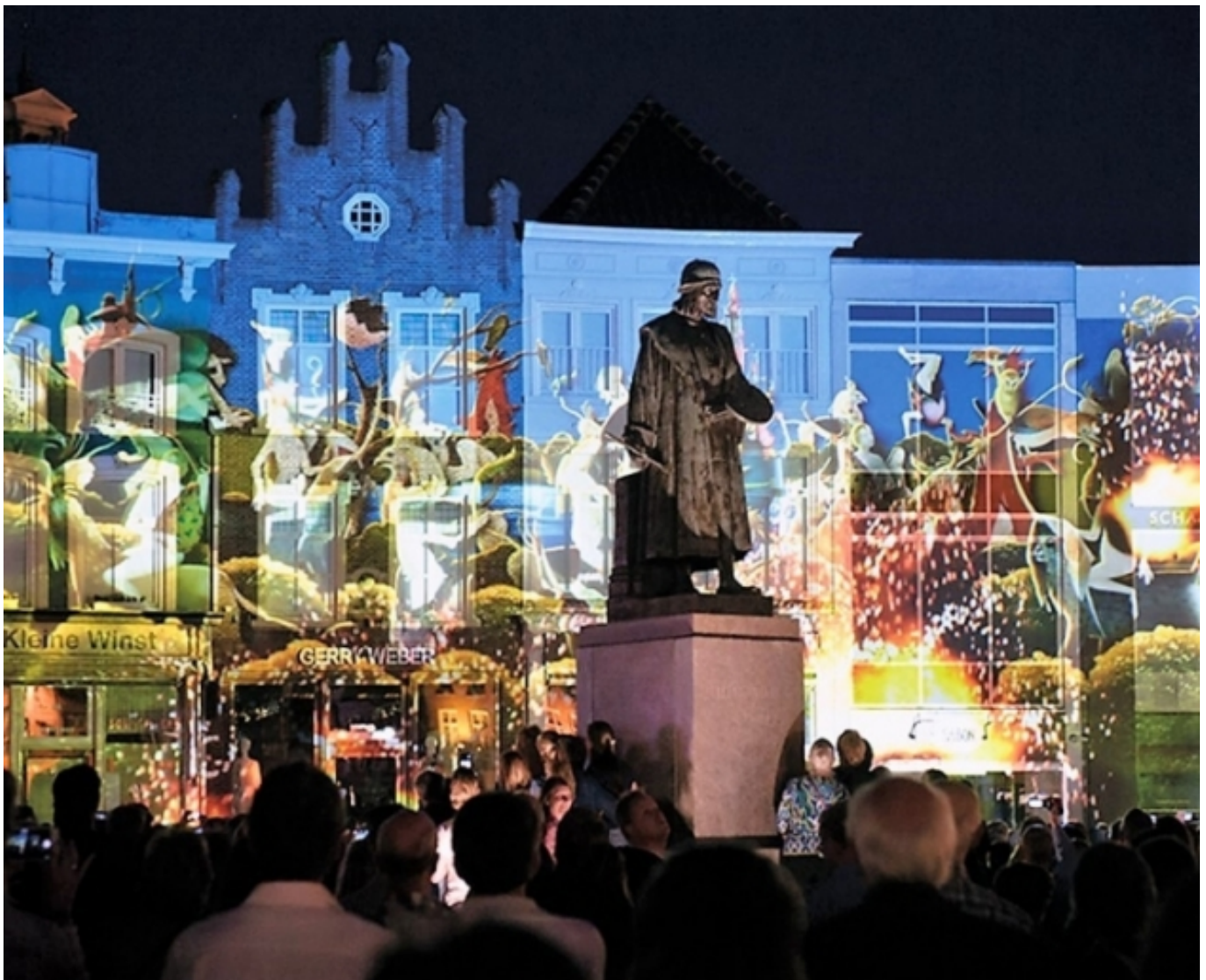
Espectacle 'Night lichtshow' de l'any temàtic 'Jheronimus Bosch 500' a 's-Hertogenbosch

Per acabar, cal tenir present que si hem estat parlant de la necessitat de col·laborar, de crear xarxes i connexions amb actors diversos de la ciutat, també crear polítiques públiques més transversals amb institucions més obertes a la ciutadania, no és d'estranyar que en l'àmbit de la mesura de l'impacte del projecte i dels seus efectes és faci ús de la paraula 'holística'. Richard i Duif (2019) fan èmfasi a l'aproximació holística a l'avaluació dels resultats de projectes , ja que no solament es tracta de fer un recompte a curt termini, sinó tenir una visió a llarg termini. Amb una visió més global vers la creació d'un projecte de tal tamany amb tota la ciutat compromesa, es fa evident que els resultats apunten cap a l'acumulació de capital social, cultural i humà, que permet la millora de la qualitat de vida, i per tant resultats a molt llarg termini per a la ciutadania. En aquest aspecte sobre la visió dels resultats del projecte a llarg termini hi incideix una variable molt important i a vegades poc valorada, es tracta del temps , i es que els bons programes necessiten temps i una bona temporalització.