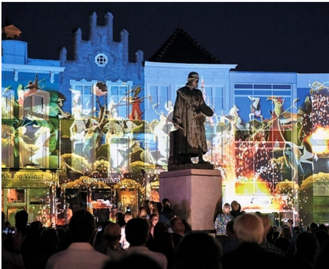
Espectacle 'Night lichtshow' de l'any temàtic 'Jheronimus Bosch 500' a 's-Hertogenbosch

Per acabar, cal tenir present que si hem estat parlant de la necessitat de col·laborar, de crear xarxes i connexions amb actors diversos de la ciutat, també crear polítiques públiques més transversals amb institucions més obertes a la ciutadania, no és d'estranyar que en l'àmbit de la mesura de l'impacte del projecte i dels seus efectes és fàcil ús de la paraula 'holística'. Richard i Duif (2019) fan èmfasi a l'aproximació holística a l'avaluació dels resultats de projectes , ja que no solament es tracta de fer un recompte a curt termini, sinó tenir una visió a llarg termini. Amb una visió més global vers la creació d'un projecte de tal tamany amb tota la ciutat compromesa, es fa evident que els resultats apunten cap a l'acumulació de capital social, cultural i humà, que permet la millora de la qualitat de vida, i per tant resultats a molt llarg termini per a la ciutadania. En aquest aspecte sobre la visió dels resultats del projecte a llarg termini hi incideix una variable molt important i a vegades poc valorada, es tracta del temps , i es que els bons programes necessiten temps i una bona temporalització.